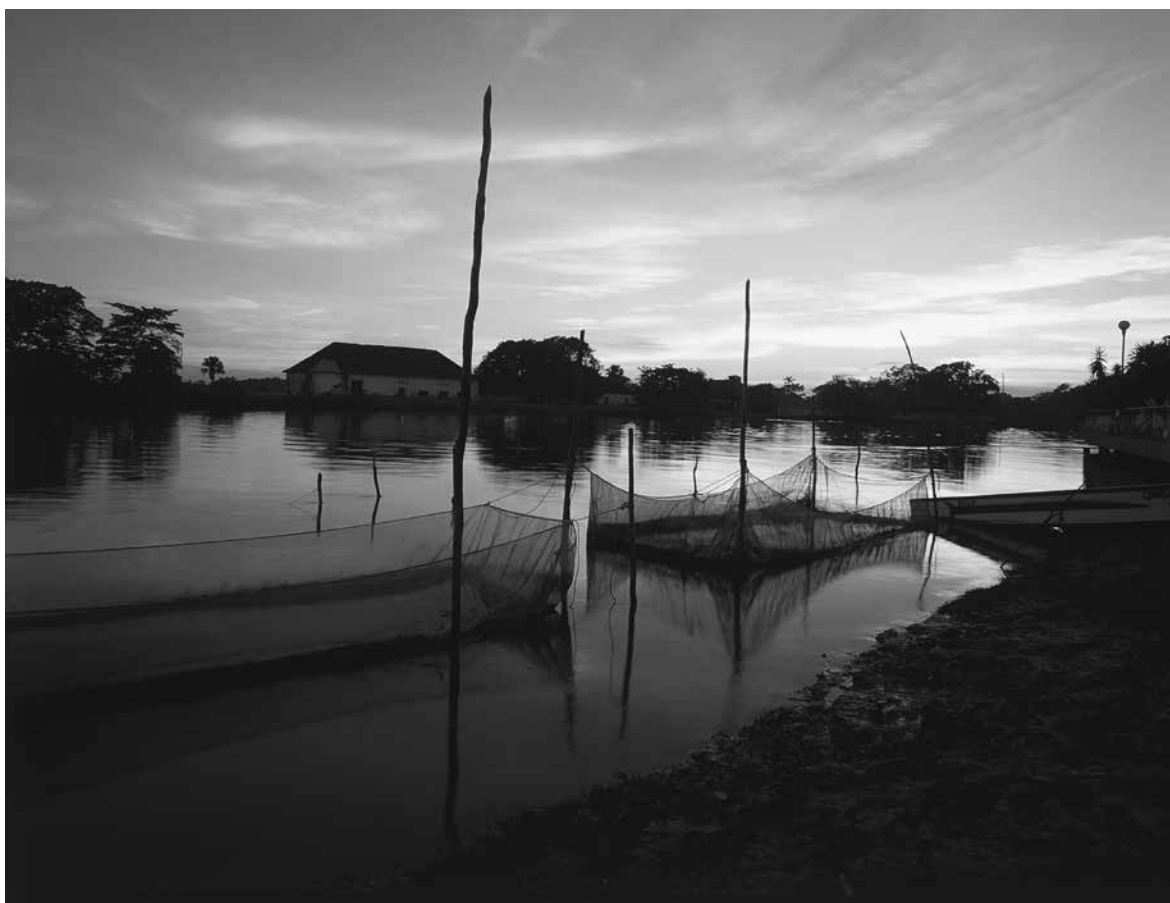
COMISIÓN MEXICANA DE FILMACIONES ▶ Sabancuy, Campeche, septiembre de 2018.

necesidades de consumo de las poblaciones más necesitadas. Así, la propuesta del gobierno neoliberal para el campo puso más énfasis en paliar la disminución del ingreso y el consumo de los mexicanos más pobres que en potenciar su capacidad productiva, de generación de riquezas y autosuficiencia económica (Herrera, 2004: 131-134). Lo irónico de estas políticas era que navegaban a contracorriente de lo que establecía el discurso oficial, pues parecían más orientadas a fomentar la perenne dependencia de los grupos rurales empobrecidos respecto a dádivas para mejorar su consumo, que a cimentar el desarrollo de sus fuerzas productivas como base para su transformación en ciudadanos independientes del Estado.