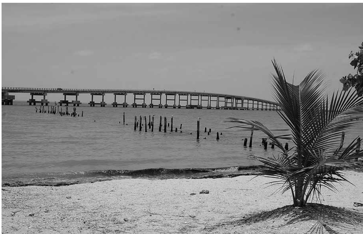
Puente Zacatal, Ciudad del Carmen, Campeche, julio de 2009.

y materiales, vitales para la reproducción de las colectividades rurales, no sólo en la dimensión económica, sino en el conjunto de la vida social (Bourdieu, citado en Gledhill, 2000: 223).