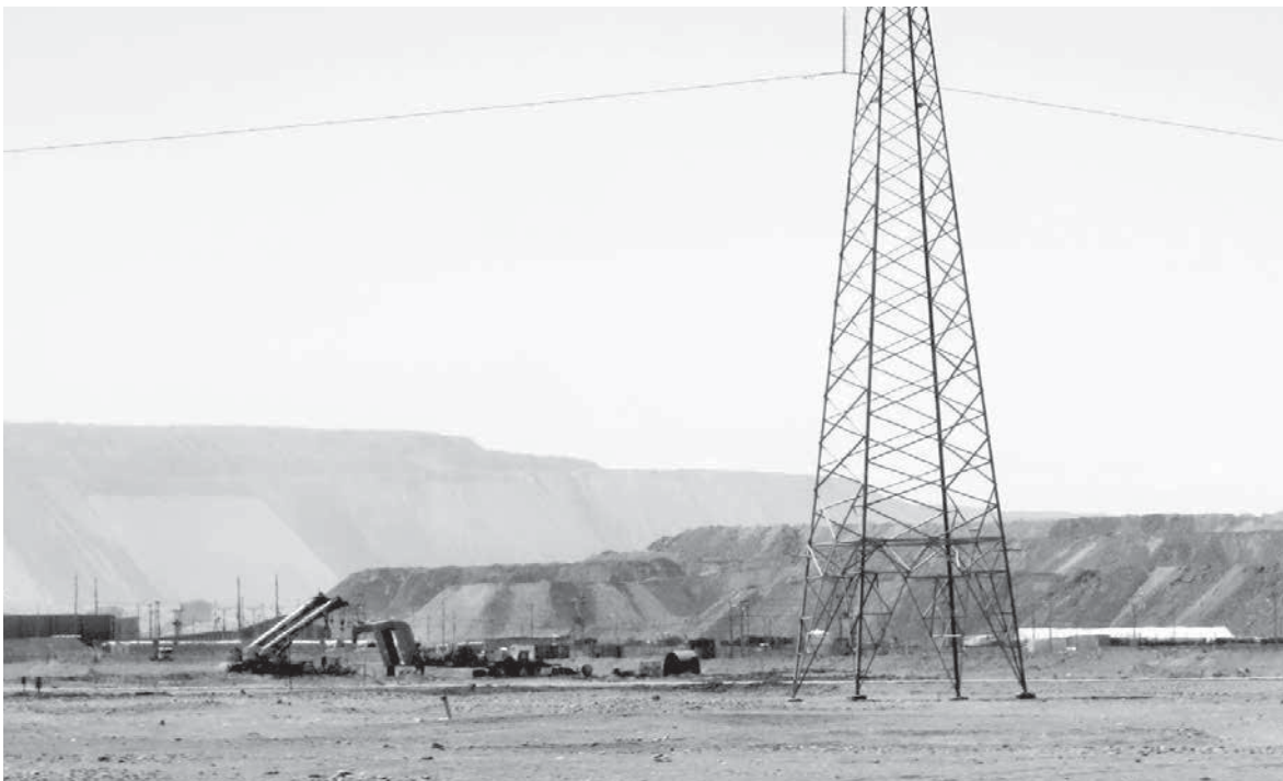
GWENNHAEEL HUESCA REYES ▶ Mina de cobre a cielo abierto de Chuquibambilla, la más grande del mundo. Calama, Chile, abril de 2015.

Estos escenarios transforman y reconfiguran de manera más acentuada la vida de pueblos indígenas, afrodescendientes y campesinos en el ámbito