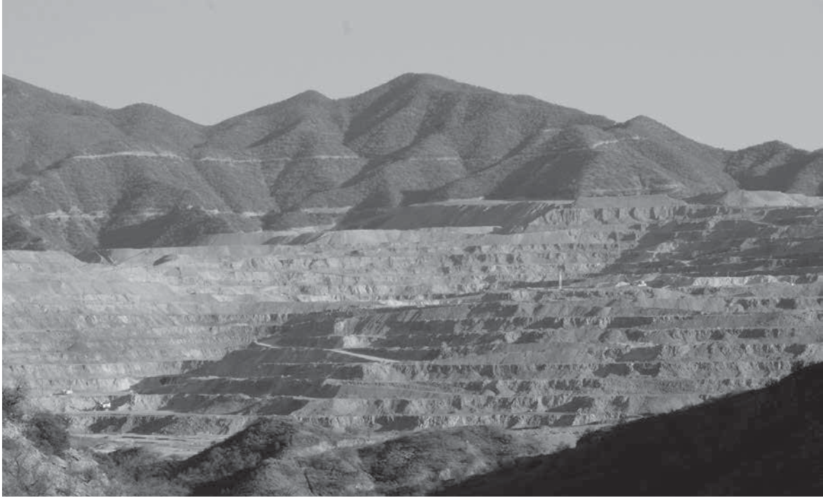
OCTAVIO HOVOS ▶ Minería en Cananea, Sonora, México, 2006.

como un problema global que requiere respuestas globales, que borran relaciones históricas de poder y desigualdades que han conllevado a dichas transformaciones. Este proceso actual en torno al cambio climático rememora el ambientalismo de las décadas de 1970 y 1980, que si bien dio lugar a varias posiciones, tendencias y concepciones, al final generó una respuesta unificada, una visión ideal y una propuesta global: el desarrollo sostenible. Ahora, frente al cambio climático, la solución global se convierte en responsabilidad de todos los ciudadanos del planeta, centrada en una visión única de naturaleza —reconfigurada— y en su uso y operación a partir del conocimiento experto. Sin embargo, todo este proceso que, al ser global, da lugar a una serie de acciones y soluciones centradas en actores específicos a escala internacional —COP, el Grupo Intergubernamental de Expertos sobre Cambio Climático—, implica una centralización, y por ende, un control