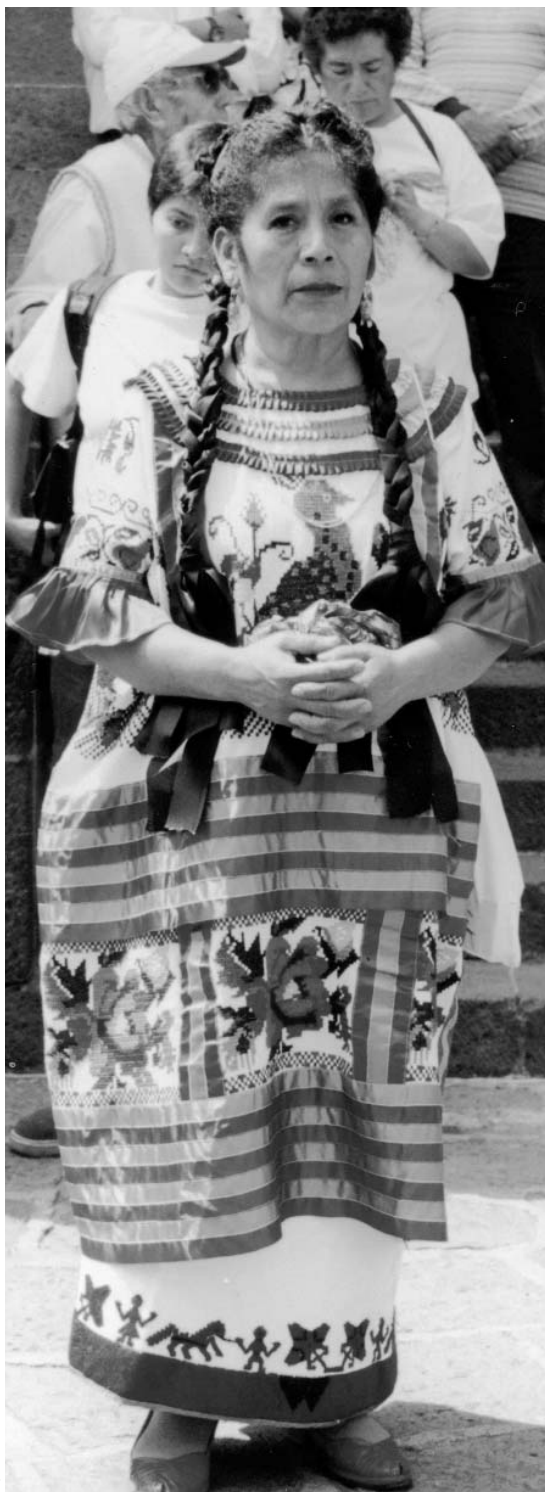
MUJER MAZATECA. FOTOGRAFÍA DE VERÓNICA BRAVO

bajo la oscura sombra de los cafetales, producida por “la madre” del café.