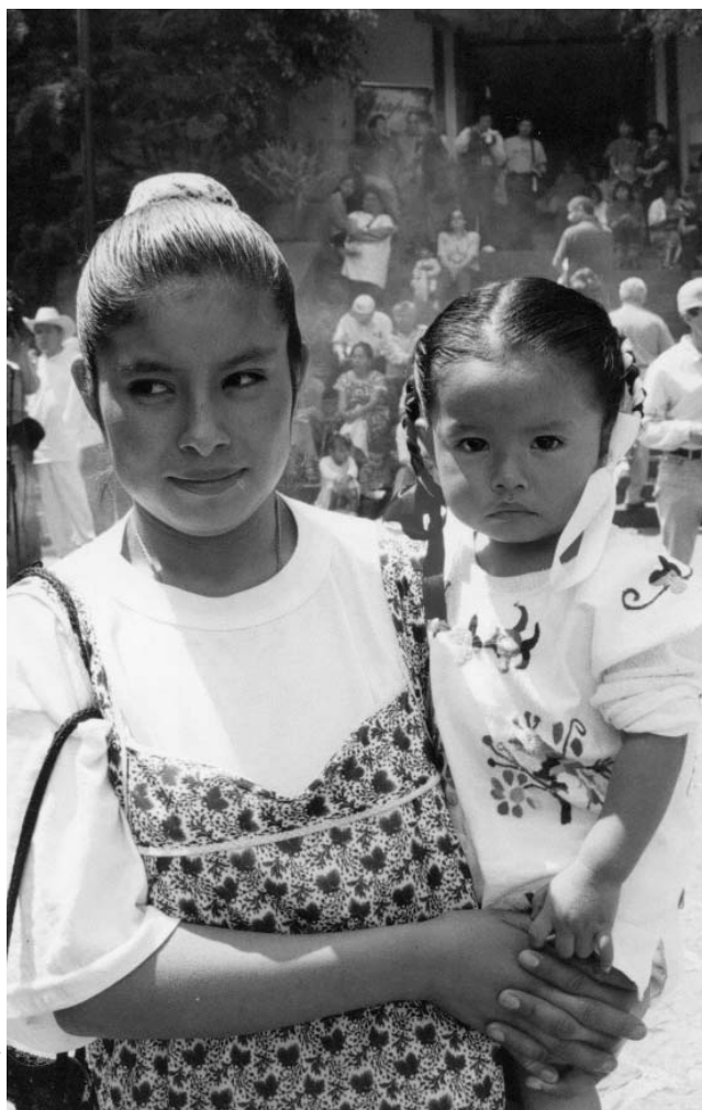
MADRE E HIJA MAZATECA. FOTOGRAFÍA DE VERÓNICA BRAVO

de los mazatecos de las tierras bajas se encontraba constituido por selva húmeda. Come gente. Abundaba antes. Tiene los pies volteados para atrás, las manos largas, cuello largo, cabeza de mono, peludo, negro, color del pellejo del chango. También tiene formas femeninas, las mujeres tienen las chichis largas. Miden dos metros y medio de alto. Son tiesos: no pueden doblarse para levantar algo del suelo, sólo pueden acucillarse. Las mujeres echan las chichis sobre los hombros. Para seguirlos, debe seguirse la dirección de la punta de los pies. Tienen abierto el vientre y se les ve el hígado, el corazón, el estómago. No les entra el plomo.