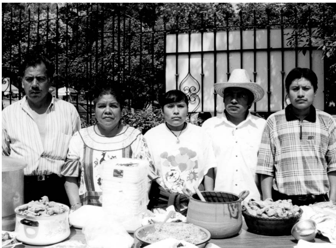
FAMILIA MAZATECA. FOTOGRAFÍA DE VERÓNICA BRAVO

En el monte cerrado, en el bosque o en cafetales muy extensos o alejados de habitaciones humanas, uno puede ser sorprendido por seres sobrenaturales, algunos poco definidos, tales como “hombres rojos desnudos”, bandas de “muchachas de huipil”, niños sospechosos, que no son tales y que atacan, todos relacionados con El Chikón o con El Maligno. De las mujeres se dice que son hijas del Chikón. 6 Son peligrosos los cafetales que se encuentran pegados a cantiles con cuevas o a grandes peñas, sumideros o cavernas, como suele suceder en Tenango, Ayutla o Chilchotla.