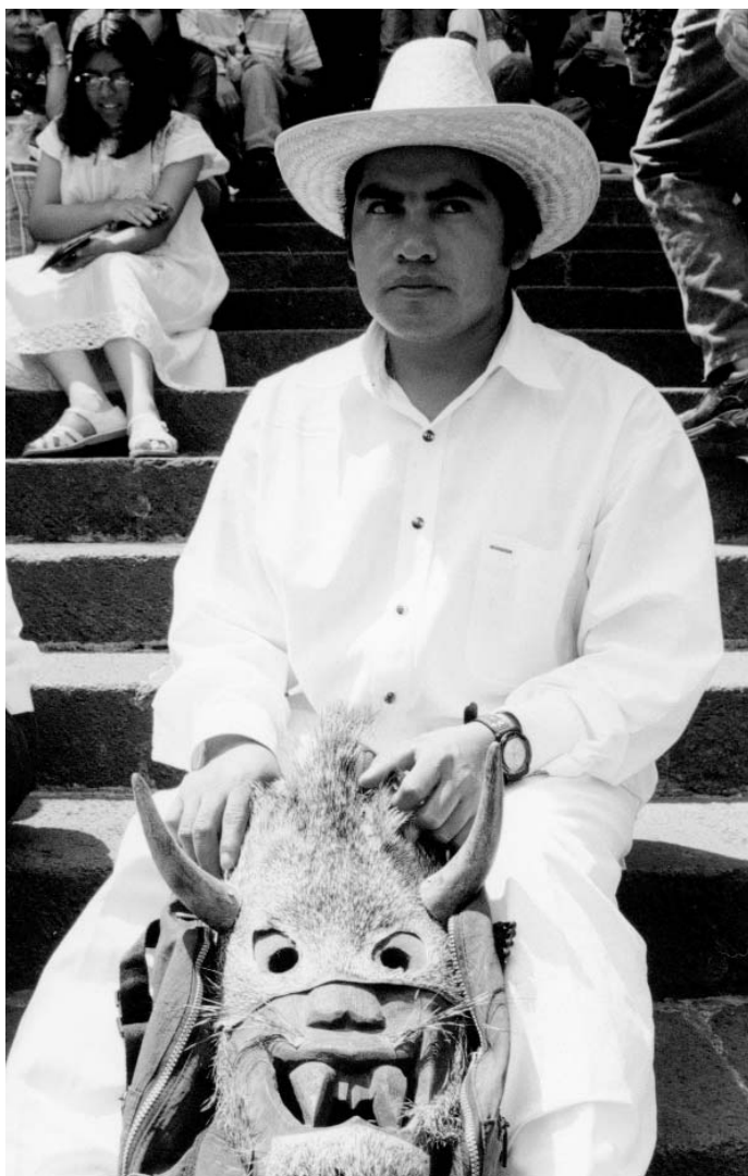
HOMBRE HAZATECO.

Otros dicen que la Virgen Isabel sostiene a la Tierra. La sostienen sobre un hombro, pero se cansa y cambia de hombro o la acomoda bien, y esto causa los temblores.