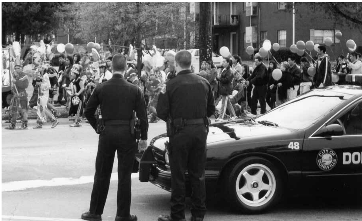
MARIE FRIEDMANN MARQUARDT ▶ Procesión en un suburbio de Atlanta, parte de la celebración del cumpleaños de la Virgen de Guadalupe. Doraville, Georgia, diciembre de 2002.

ceremonia con guitarras e instrumentos de percusión bajo la batuta de un laico jalisciense. Cantan y tocan a ritmo ranchero banda y baladas en español. Los 12 pares de ministros de la Eucaristía son mexicanos o de origen mexicano. Varios recién nacidos son presentados a la congregación y en caso de que algún creyente celebre su cumpleaños o aniversario de boda todos entonan Las mañanitas . Los asistentes enlazan sus manos al recitar el Padre Nuestro, se dan la mano en señal de paz mientras el sacerdote pasea por el templo haciendo lo mismo con los asistentes. Al finalizar el sacramento, los fieles pasan al salón de la parroquia y toman café y donas.