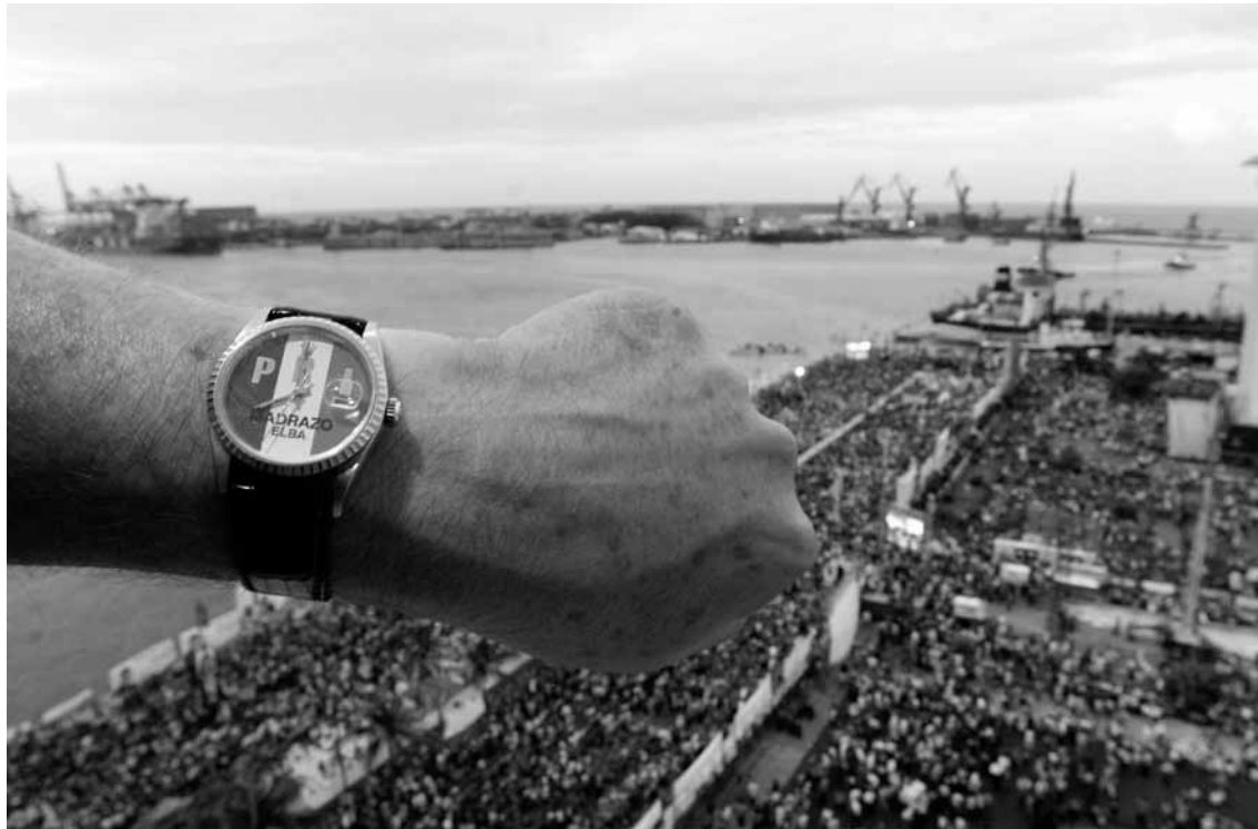
Veracruz, México. Un simpatizante de Roberto Madrazo Pintado, candidato a la presidencia de la República por el PRI, muestra su reloj con el logotipo del partido, 28 de junio de 2006.

El registro y balance acerca de las tendencias en curso en torno a los ocho ámbitos funcionales de las tres metrópolis evidenciaron que en ellos se están dando reajustes y cambios significativos. Éstos son de doble signo: desactivadores de anteriores