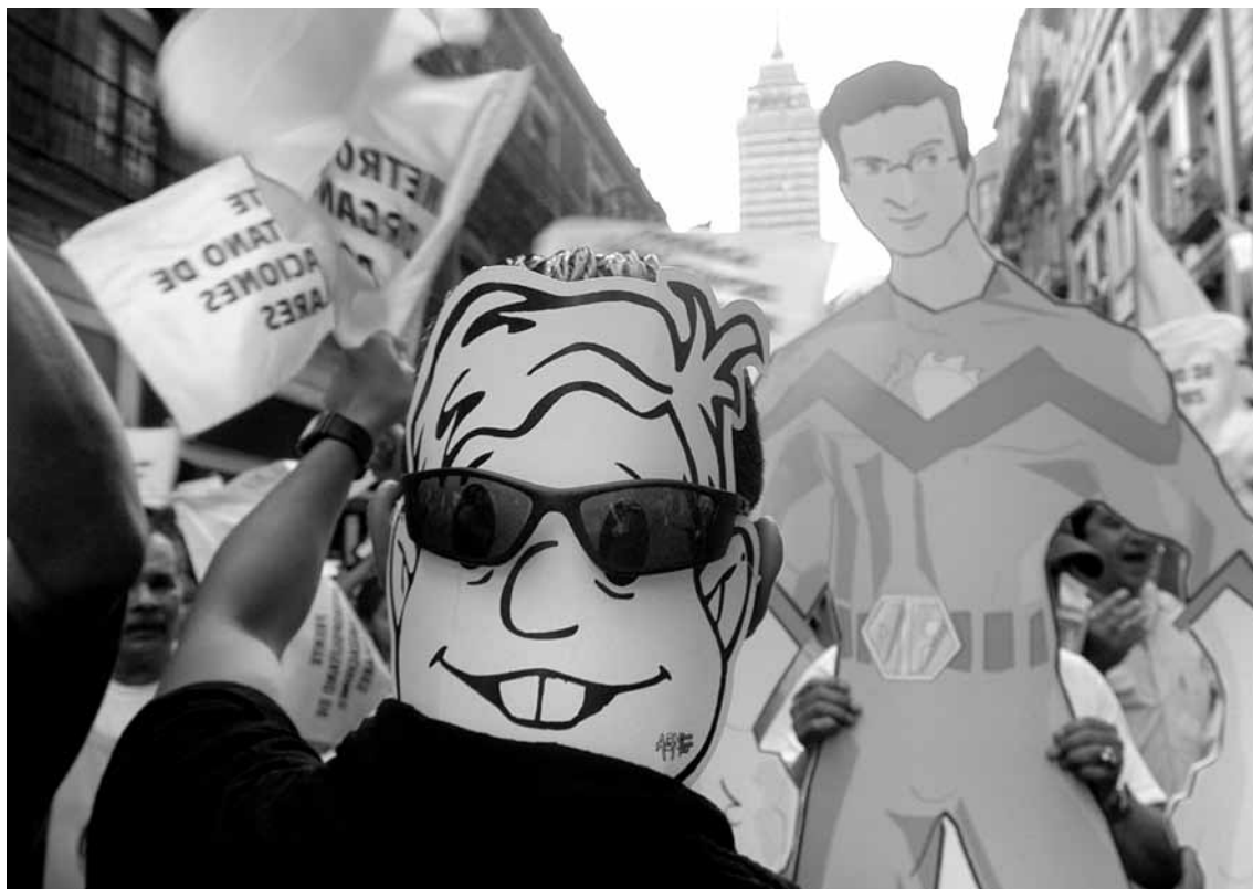
Ciudad de México, México. Mitin de Andrés Manuel López Obrador en el Zócalo, 6 de junio de 2006.

fueron objeto de proyectos de recuperación y refuncionalización urbana. 2 A diferencia de lo sucedido en Guadalajara y Monterrey, en el Distrito Federal no ha habido una remodelación reciente del Zócalo, aunque en 1994 se inició un proceso no consolidado