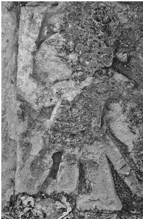
Guerrero jaguar, relieve de Yanhuatlán.

sobre el Código Porfirio Díaz y los lienzos de Coixtlahuaca. Uno de los puntos clave para la lectura del lienzo es el trabajo que realiza van Doesburg en las comunidades mismas registradas en el documento. Su visita a los pueblos productores de sal de la Mixteca Baja constituyó el elemento fundamental para su reveladora interpretación: la identificación de las fincas salineras representadas en el lienzo y, sobre todo, su notable descubrimiento de los señores implicados en el asunto central que trata el manuscrito.