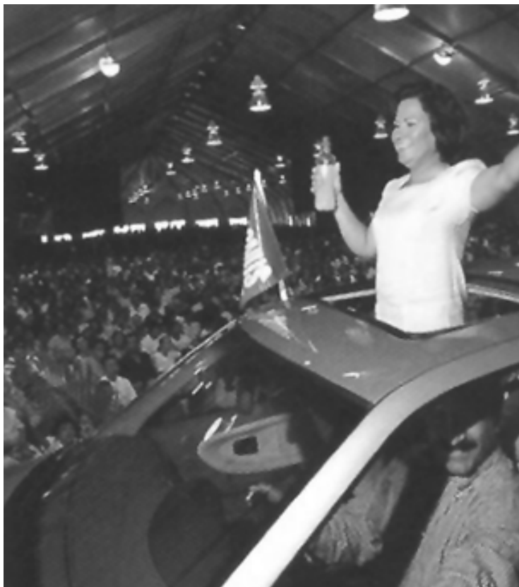
Imagen tomada de la revista WOW , que publicita a los distribuidores de Omnilife.

La autora nos recuerda, sin embargo, que las empresas no han promovido de manera explícita que la distribución sea una actividad de mujeres, sino que en la práctica se ha convertido —en México como en tantas partes— en una forma muy feminizada de obtención de ingresos. En Estados Unidos, dice la autora, el trabajo en las multinivel es una “opción de empleo de tiempo parcial para aquellos grupos marginados por los crecientes estándares de educación y dedicación para ocupar un puesto en una firma. Y entre ellos, las mujeres, cuya responsabilidad doméstica disminuye sus posibilidades en el mercado laboral” (p. 31). Sin duda es también el caso de México. Aunque Cristina sugiere ser cuidadosa con su fuente, calcula que podrían existir algo así como 1 millón 650 distribuidores; en varios casos, la única fuerza de ventas la constituyen las mujeres (p. 32). En un apartado breve pero ejemplar, Cristina da cuenta de cómo el crecimiento alcanzado por las empresas multinivel en México está vinculado con la crisis de 1994-1995, pero también con los cambios en la condición demográfica y laboral de las mujeres, que las ha convertido en el eslabón más frágil y sensible susceptible de aceptar condiciones de trabajo como las que ofrecen las empresas multinivel (pp. 36-42)