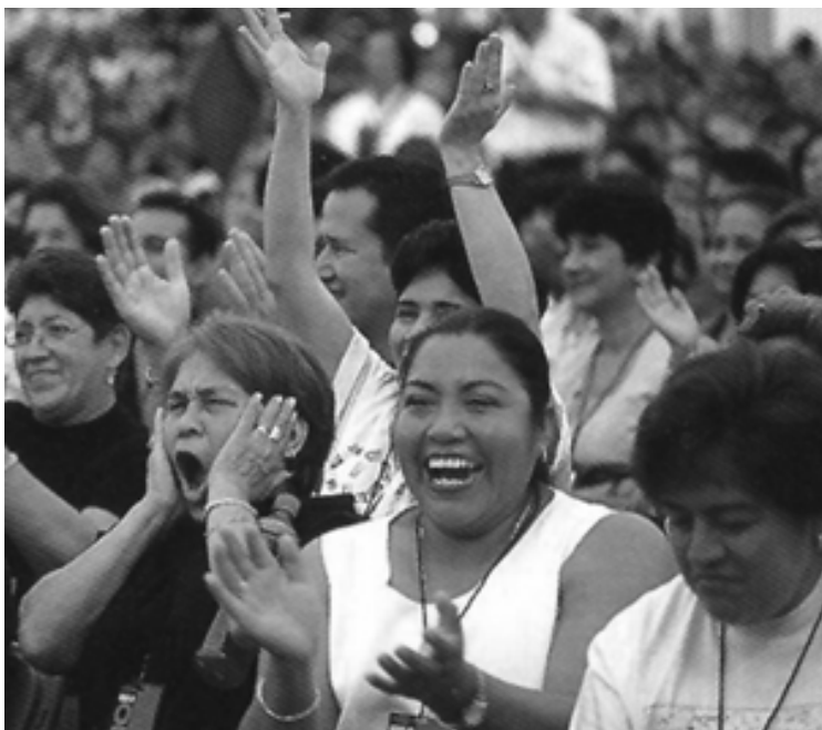
Imagen tomada de a revista WOW , que publicita a los distribuidores de Omnilife.