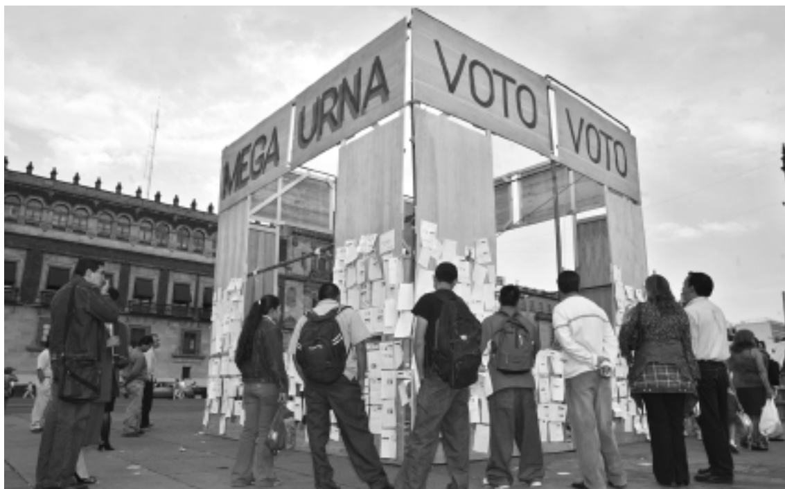
Mega urna donde cientos de ciudadanos pegaron copia de su credencial de elector con mensajes de apoyo a Andrés Manuel López Obrador, Zócalo de la ciudad de México, 26 julio del 2006.

del movimiento sobre las instituciones existentes. Entonces se vislumbrará la movilización de diversos recursos: legales y electorales (a través del FAP), políticos (a través de la existencia de la presidencia legítima y los avances en la organización del nuevo constituyente), organizativos (generados a través de las redes y alianzas con sindicatos y organizaciones populares), y de resistencia (a través de acciones colectivas de distinto tipo).