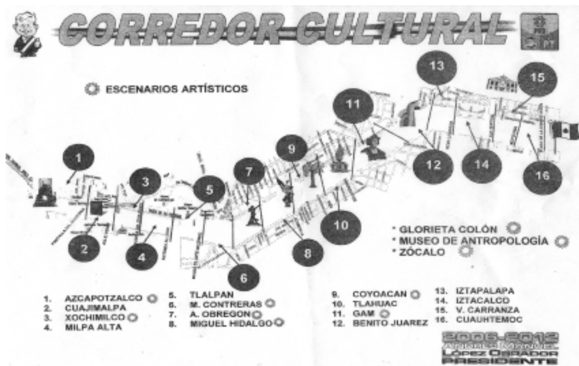
Mapa 1. Apropiación simbólica de organizaciones y ciudadanos en el megaplantón