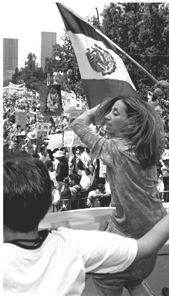
Marcha promovida en el D. F. por varias organizaciones en contra del aborto, septiembre de 2000.

Finalmente, un elemento social que refuerza esta ambigüedad es el escaso conocimiento que tiene la población de las normas en general y, en particular de las relativas al aborto, ya que, según una encuesta reciente, poco menos de la mitad de la población (45%) sabe que el aborto está permitido en México sólo en algunas circunstancias (Population Council y Grupo IDM, 2001: 4), por lo que es posible suponer que el resto de la población es susceptible de aceptar la definición conservadora del aborto sin ponerlo en duda.