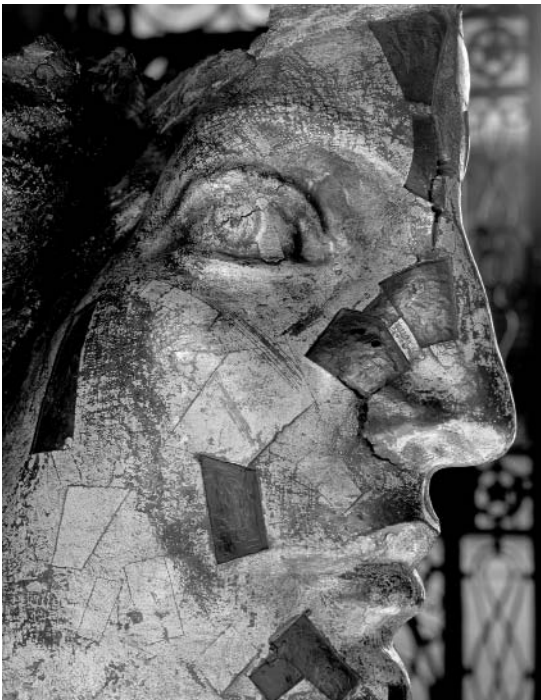
Ángel 1 / Foto: Lilian Stein.

La centralidad del sujeto en la razón. El planteo de la objetividad y la objetivación supone también que el sujeto tiene acceso a la realidad a través de la razón y que ésta es la posibilidad misma del conocimiento objetivo. El individuo se define por la capacidad racional misma, de acuerdo con Descartes: pienso luego existo. El sujeto se define por su capacidad racional, esencia que permea su individualidad, núcleo de su individualidad e identidad. La razón provee al individuo de estabilidad, homogeneidad y coherencia interna y esta centralidad del individuo en la razón, a su vez, le otorga la posibilidad de conocer objetivamente, construir verdades objetivas e indirectamente, la posibilidad de dominio sobre la naturaleza y, por lo tanto, de libertad.