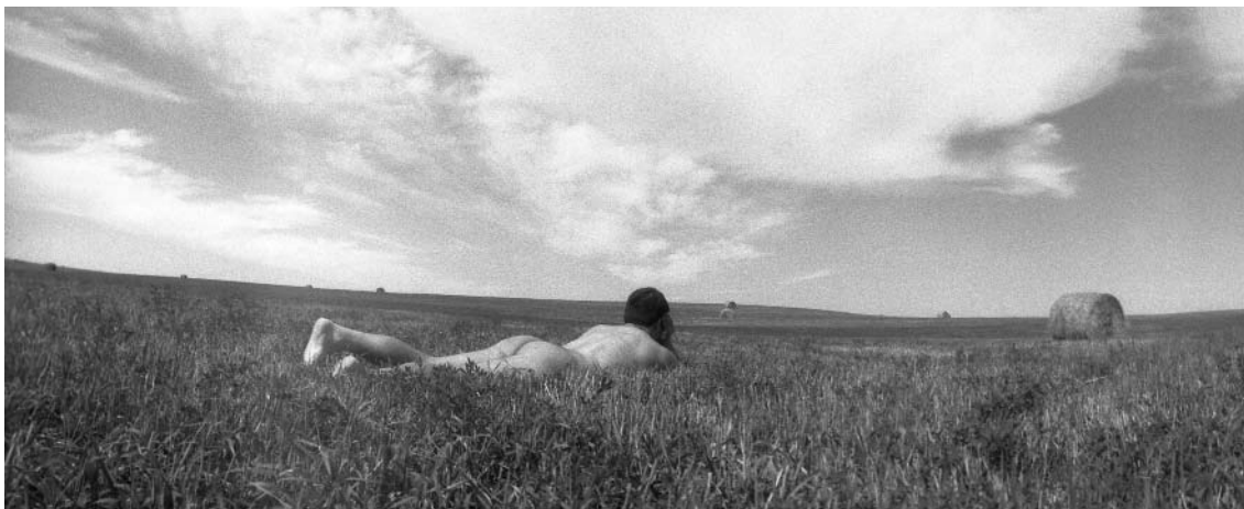
Tomando el sol / Foto: Lilian Stein.

reflexividad, como señala Bourdieu en su tratado sobre la reflexividad en la ciencia (Bourdieu, 2001). Una labor que implica, incluso, estudiar a los estudiosos de los objetos de análisis científico, para tratar de entender la relación entre sus trayectorias de vida hecha habitus (incluyendo sus habitus “masculinos”) 5 y las particulares maneras de intervenir en el campo científico en específico. La tarea así planteada es grande y este ensayo se dirige a abrir algunas líneas de discusión.