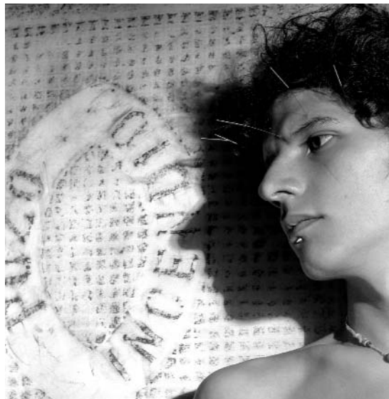
Pozo incendio / Foto: Lilian Stein.

bres” nunca son excluidos y dañados en lo que respecta al conocimiento? ¿La epistemología de la ciencia moderna ha permitido el conocimiento de “los hombres”? ¿Podemos esperar que la epistemología que excluye a las mujeres del conocimiento, objetivándolas y naturalizando su situación socialmente construida, sirva para conocer a los varones? ¿Qué relación existe entre los varones concretos y un modelo epistémico que contribuye a la exclusión y dominación de las mujeres? ¿En qué consiste el vínculo entre epistemología y género? ¿Desde qué su-