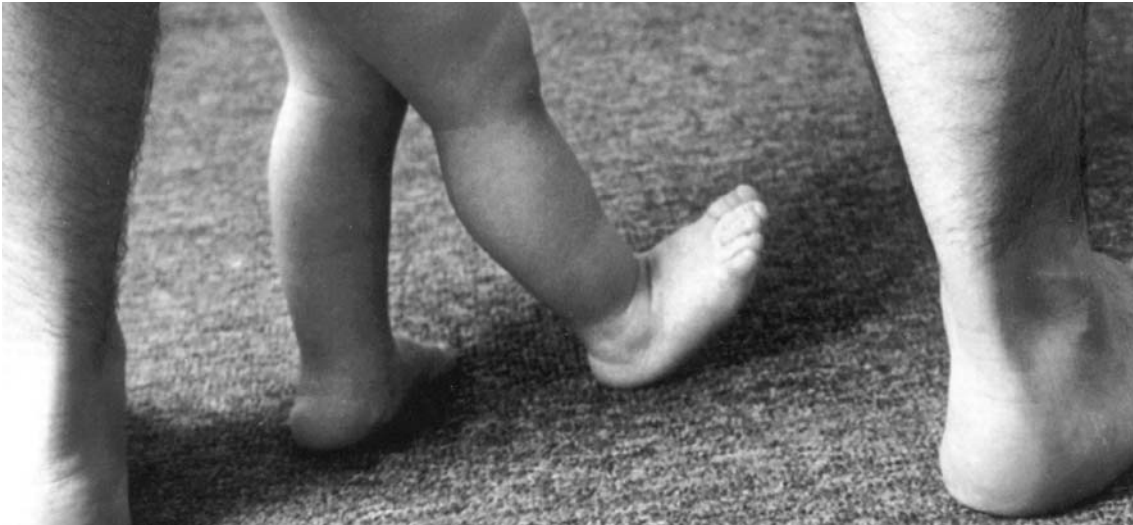
Paternidad afectiva. Calendario Coriac 2001 / Foto: Tania Robledo. Cortesía de Coriac.