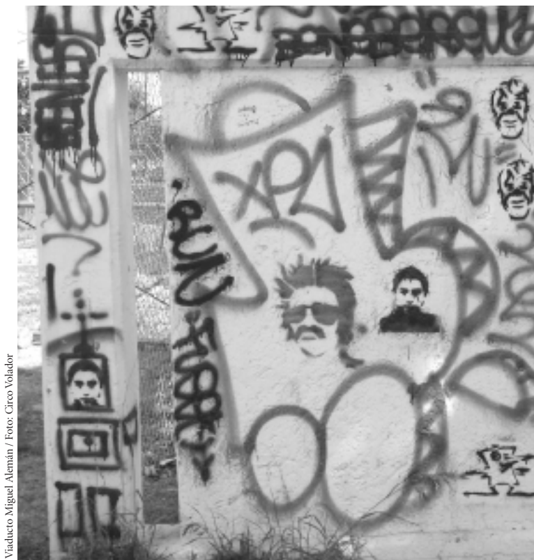
Viaducto Miguel Alemán

le llama “encontronazo”, dadas las condiciones en las que la pedagogía hace uso de lo antropológico). Pero la misma antropología está en estos momentos en un proceso de cambio y redefinición, donde su intervención en los procesos llamados ahora multi e interculturales vinculados con las grandes transformaciones sociales vividas en las dos últimas centurias la obligan a una justa y merecida reflexión. Para ello Gunther Dietz realiza un análisis meta-etnográfico, una propuesta conceptual sobre los términos de cultura e identidad y una propuesta metodológica que conecta las anteriores reflexiones. Todos ellos hacen más comprensible su vinculación con las nuevas propuestas interculturales.