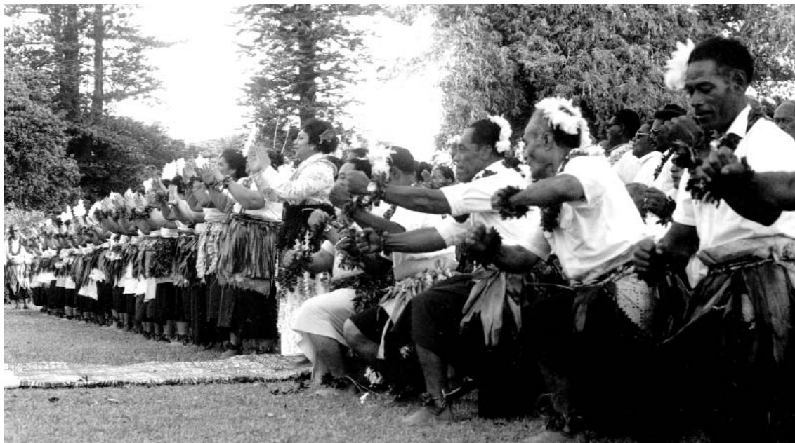
Performance lakalaka de Tonga. Polinesia Occidental, 1967.

fuertes y viriles. Por otro lado, en Hawai, hombres y mujeres interpretan los mismos movimientos coreográficos pero sus motivos varían dependiendo del género (por ejemplo, los hombres usan menos flexión y extensión de la muñeca, y pueden cerrar el puño mientras que las mujeres extienden los dedos).