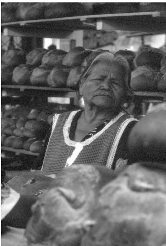
De la serie: Mercados hecho a mano, 2000 / Roxana Acevedo

En gran medida tanto las fallas en las políticas públicas como los factores estructurales del orden genérico han contribuido a mantener esta situación, pero también las prácticas cotidianas de los hombres mismos y los beneficios que obtienen de la desigual distribución de poderes y recursos. Por esto no es de extrañarse que los esfuerzos por modificar el panorama de la salud reproductiva hayan destacado el papel de los hombres como obstáculos o facilitadores de los derechos reproductivos de las mujeres. No obstante, esto no significa negar a los hombres necesidades e intereses propios. De acuerdo con documentos de Naciones Unidas, la participación masculina vinculada a la salud reproductiva es un término “sombrija” para abarcar los diferentes caminos en los cuales los hombres se relacionan con los problemas y los programas de salud reproductiva. Por un lado se