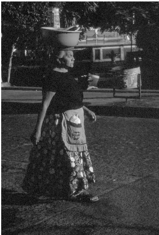
De la serie: Mercados hecho a mano, 2000 / Roxana Acevedo