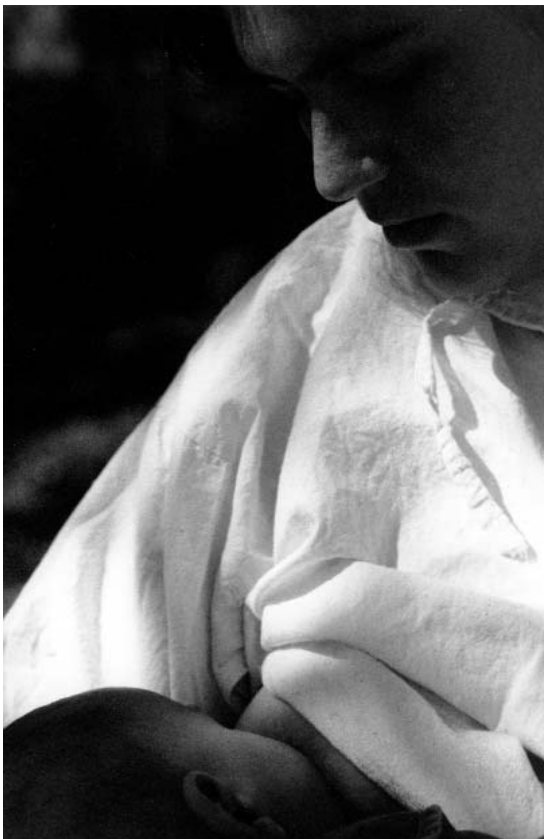
De la serie: Entre dos te quiero más, 2003 / Roxana Acevedo

son los grandes “olvidados” en el discurso de los derechos reproductivos, pero los argumentos utilizados más parecen orientados a competir con las mujeres y arrebatárles espacios de legitimación que a construir relaciones solidarias o dismantlar las estructuras de dominación. Especialmente parecen dirigidos a recuperar el protagonismo de los hombres al irrumpir en espacios que permiten a las mujeres desafiar los poderes masculinos. Todo ello en un contexto de endurecimiento hacia cualquier forma de autodeterminación y bajo un discurso que facilita interpretar los actos afirmativos de las mujeres como formas de transgresión, de agresión o desafío a lo que se consideran los “derechos” de los hombres.