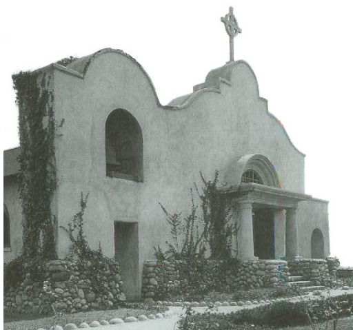
Capilla Episcopal de Saint James, en La Jolla, California, diseñada por Irving Gill en 1908.

español, en ocasión de la feria que celebraba en 1915 la apertura del Canal de Panamá, todo ello ubicado en el hoy famoso Balboa Park. Allí permanecen esas obras, algunas con detalles un tanto escenográficos en las fachadas, sin dejar de reconocer su intento de preservar elementos de la arquitectura Spanish Colonial, como denominaron los críticos norteamericanos a principios del siglo veinte a la suma ecléctica de las formas renacentistas y barrocas. 12 Sería hasta los años cincuenta cuando la historiadora de la arquitectura Esther McCoy, en su obra Five California