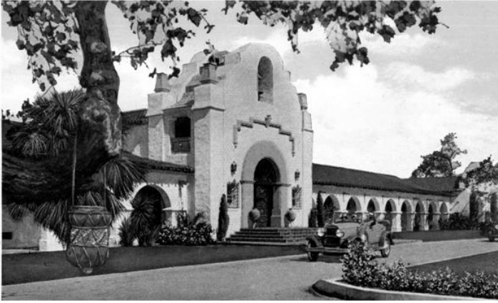
Entrada al Hotel de Agua Caliente, Tijuana.

Las fachadas de los edificios de Agua Caliente tienen el estilo, el aire de las misiones que imprimía Irving Gill a sus proyectos, como se puede apreciar en las fotografías incluidas en este artículo.