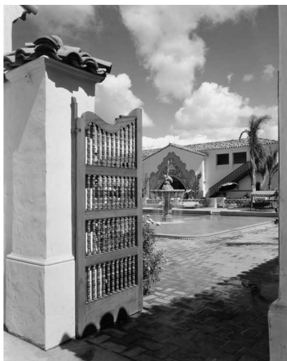
Cancel de ingreso a la alberca de Agua Caliente.

lo que fue uno de los propulsores del llamado estilo misión, que consistía en recrear los lenguajes renacentistas del siglo dieciséis novohispano, como lo hizo con las conocidísimas sillas fraileras. Ese mismo tipo de asientos simplificados, resistentes y funcionales inspirarían los muebles estilo misión, que elaboraban en el estado de Nueva York varias compañías, entre ellas la de los hermanos Stickley, así como los que después se manufacturaron en Tijuana, a finales del siglo veinte y principios del veintiuno, en la fábrica Douglas Furniture. En esta empresa se rediseñaron con algunas variantes, como el reposed, que incluyen herrajes y dispositivos que permiten el movimiento. Lamentablemente, en la actualidad la compañía los fabrica en China, muy lejos del ámbito que los originó (Bejarano, 2007:93).