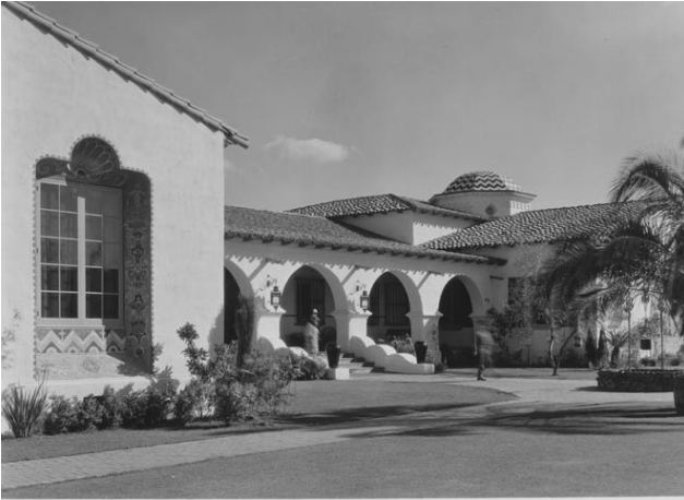
Área de acceso al Casino de Agua Caliente, que incluía a la derecha el llamado "Pozo de los Deseos".

que trajeron los frailes franciscanos: tornos para madera, sierras braceras y cuchillas para los cepillos que se empleaban en los rebajes y resagues. Esas rudimentarias pero eficientes herramientas hicieron posibles paradigmáticas obras en madera, que serían repetidas una y otra vez en el futuro.