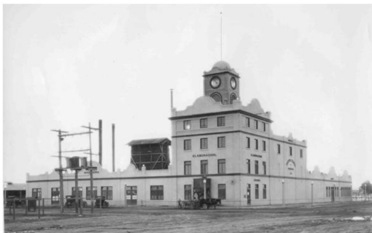
Edificio de la Cervecería Mexicali, inaugurado en 1923.

Social, Cívico y Cultural Riviera, a diferencia del de Tijuana, del que sólo quedan algunos vestigios. 18