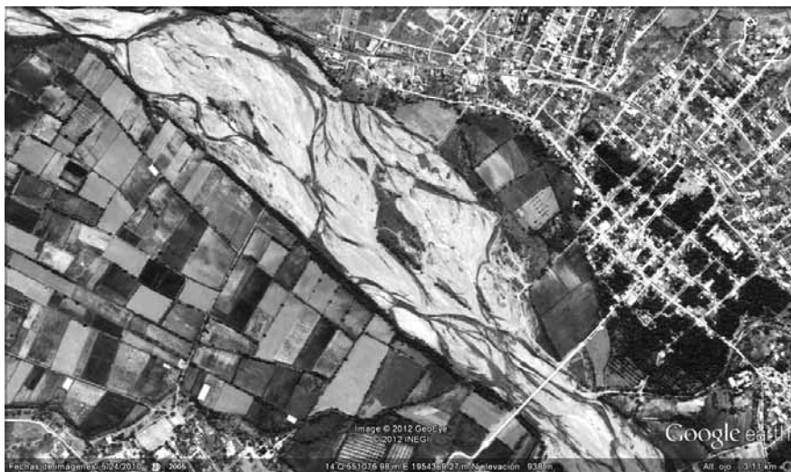
Foto 1 Protecciones ribereñas en Alpoyecá

Los saucos forman una línea divisoria a manera de frontera entre el lecho del río y los cultivos, sin embargo, son susceptibles de ser destruidos por las crecidas del río. Fuente: Google Earth y datos de campo, 2009.