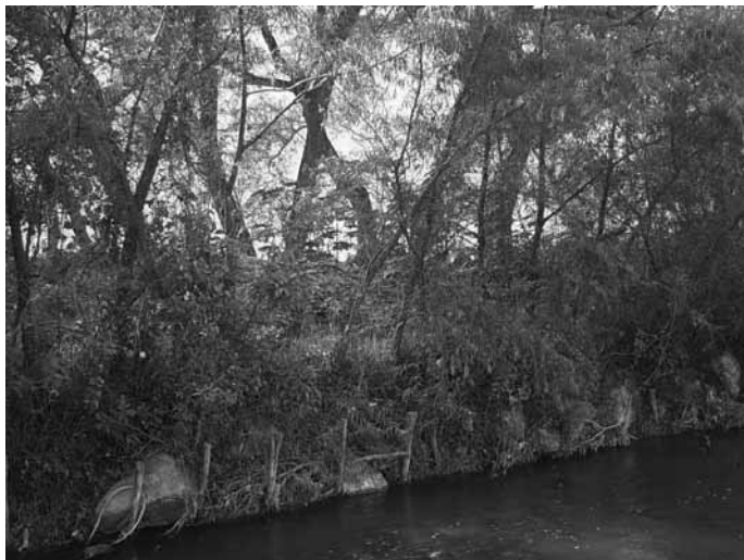
Obsérvense los materiales: piedras y estacas.