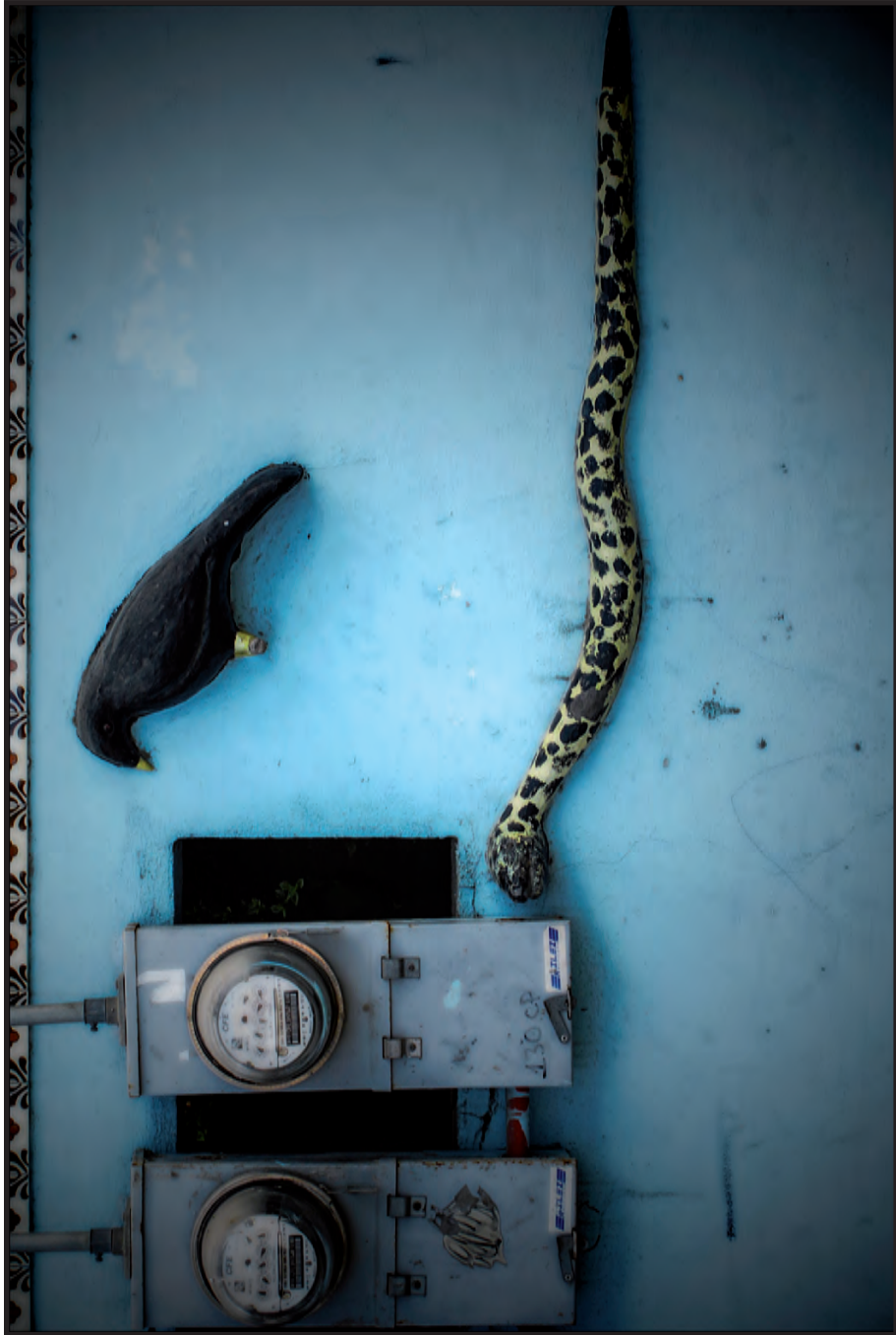
Extinción o solución