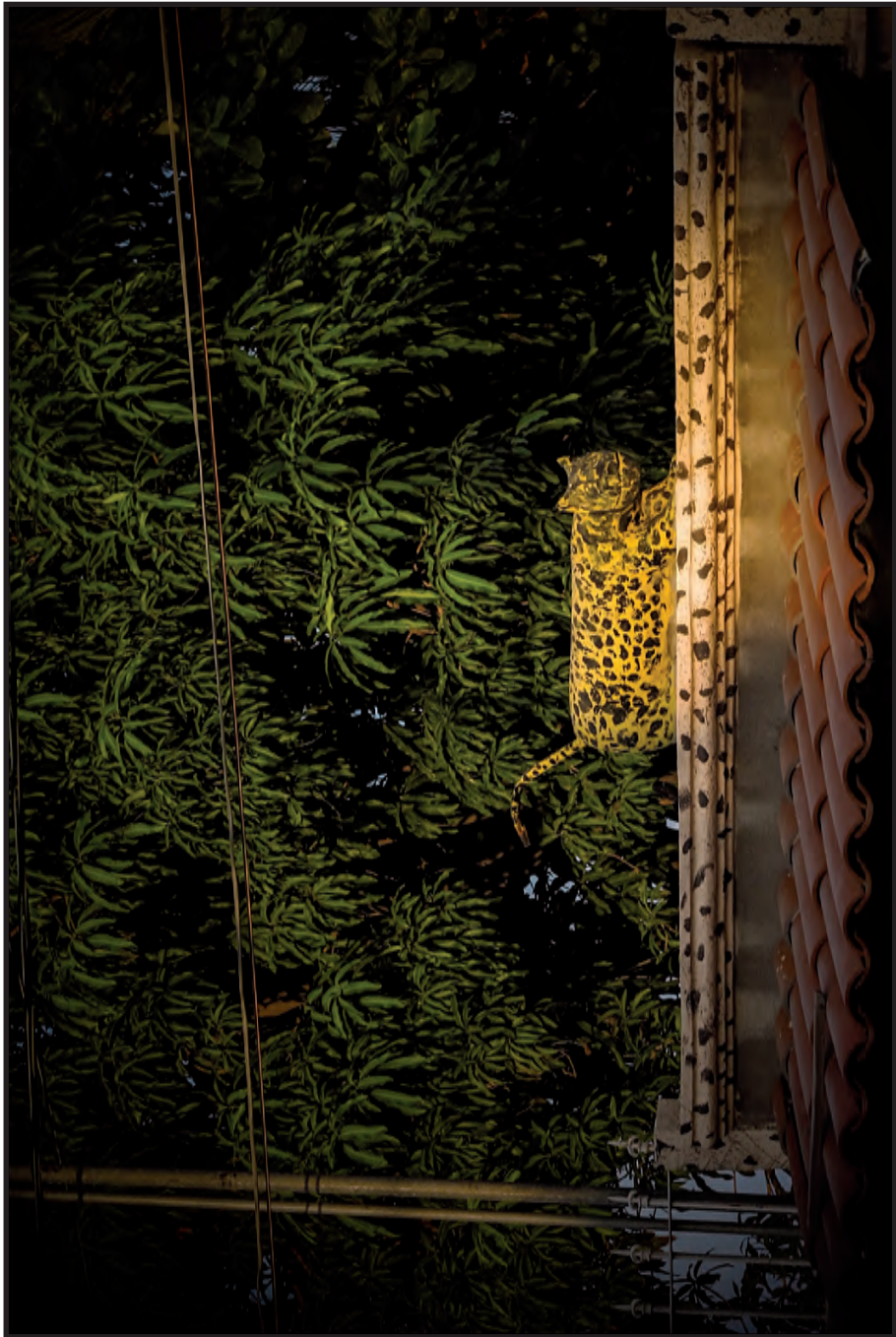
Extinción o solución