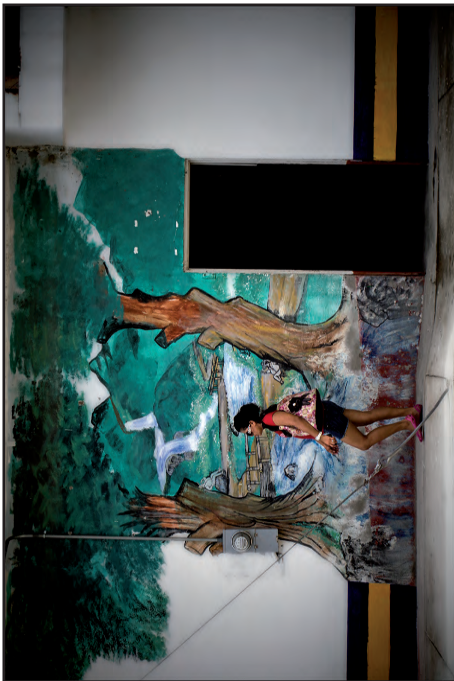
Extinción o solución