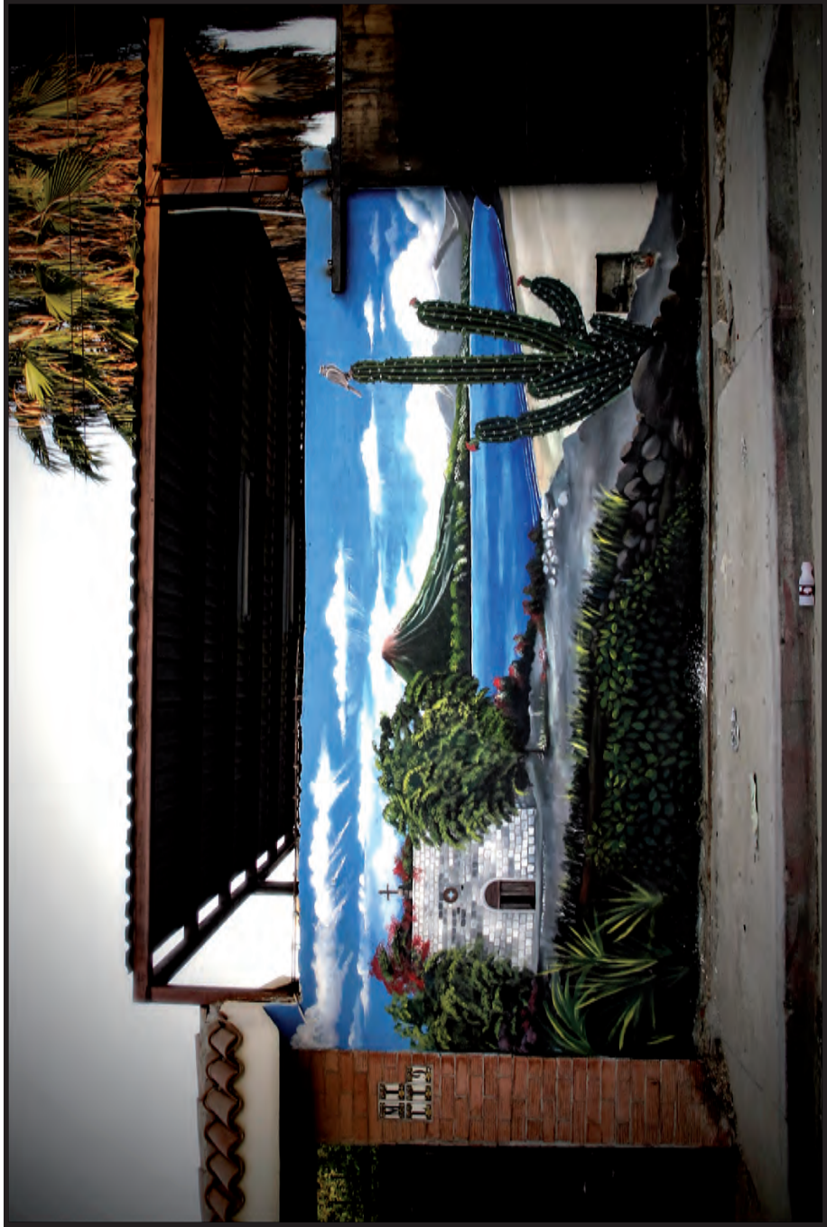
Extinción o solución