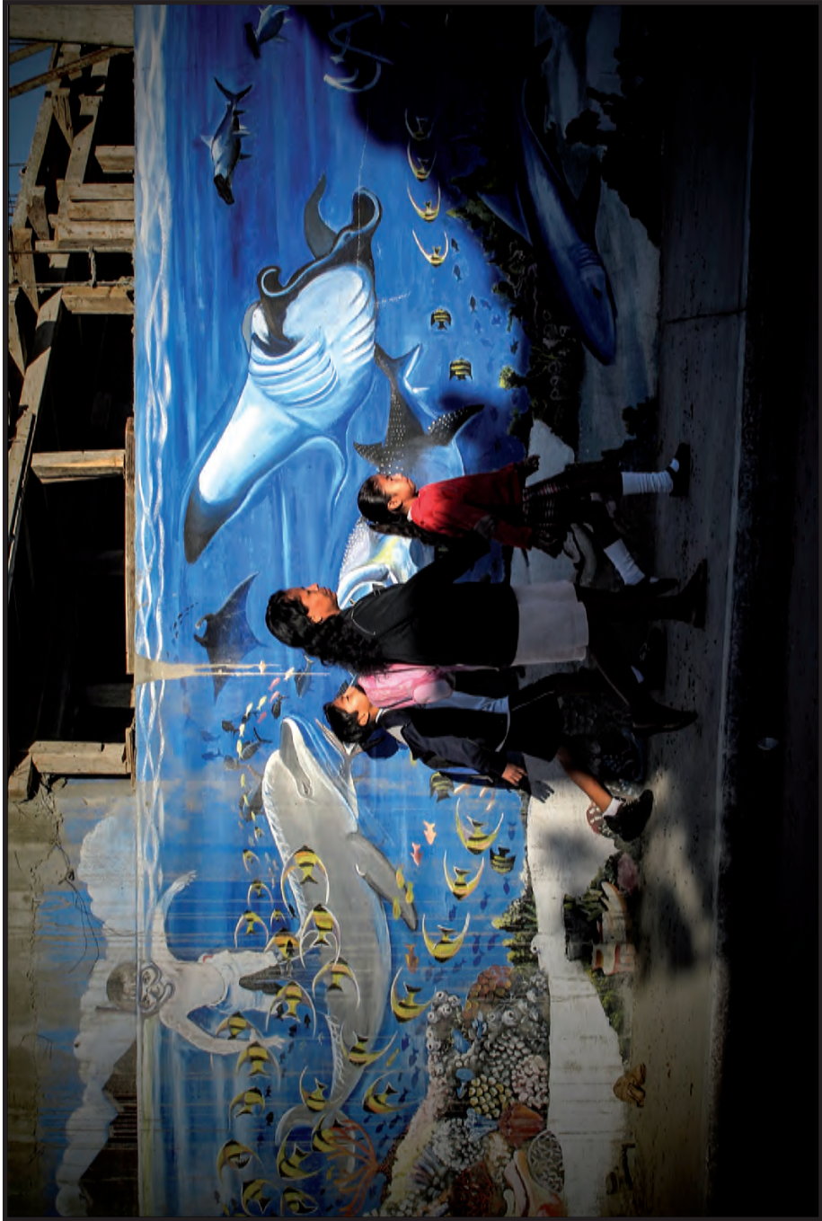
Extinción o solución