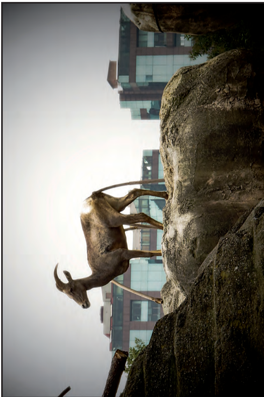
Extinción o solución