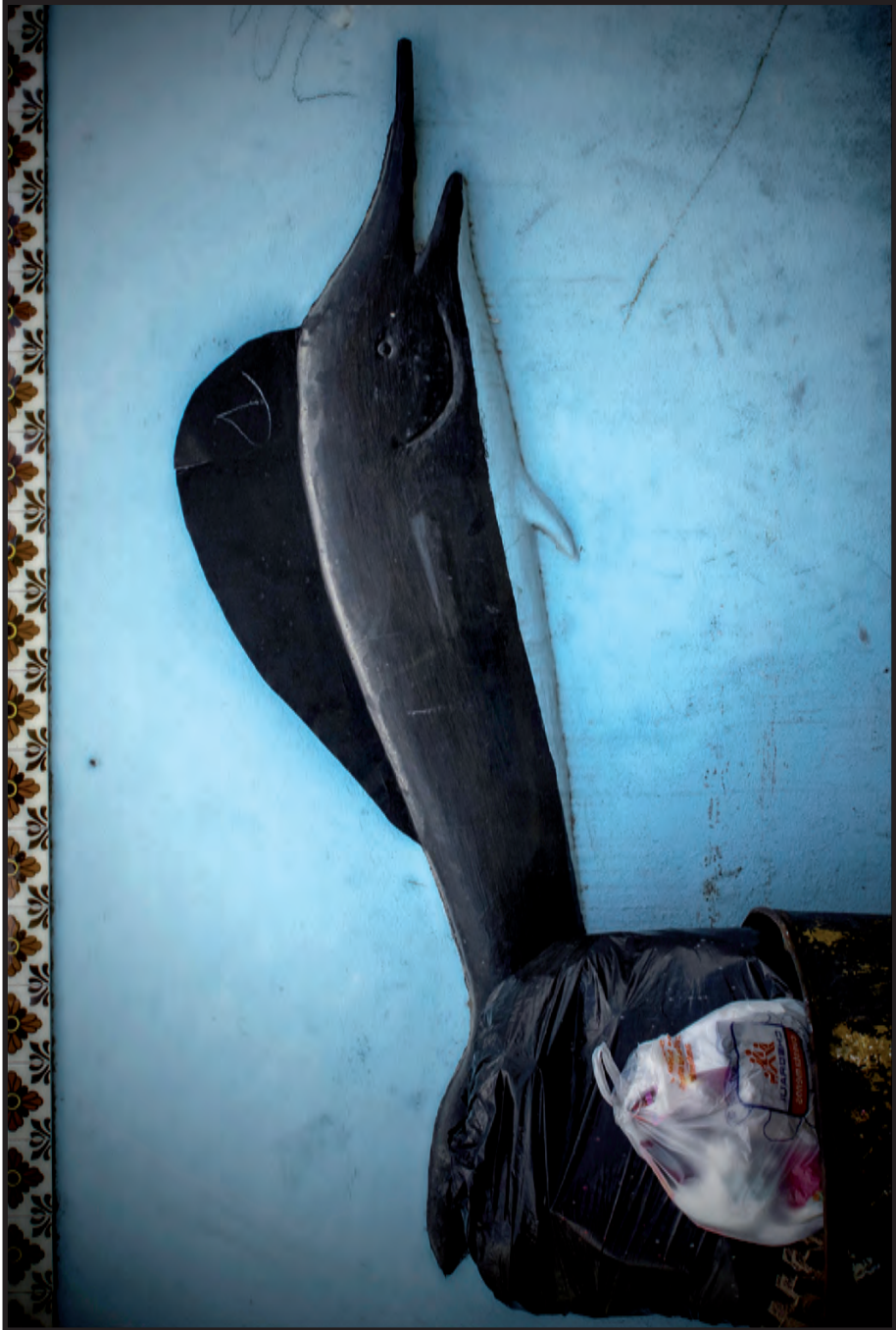
Extinción o solución