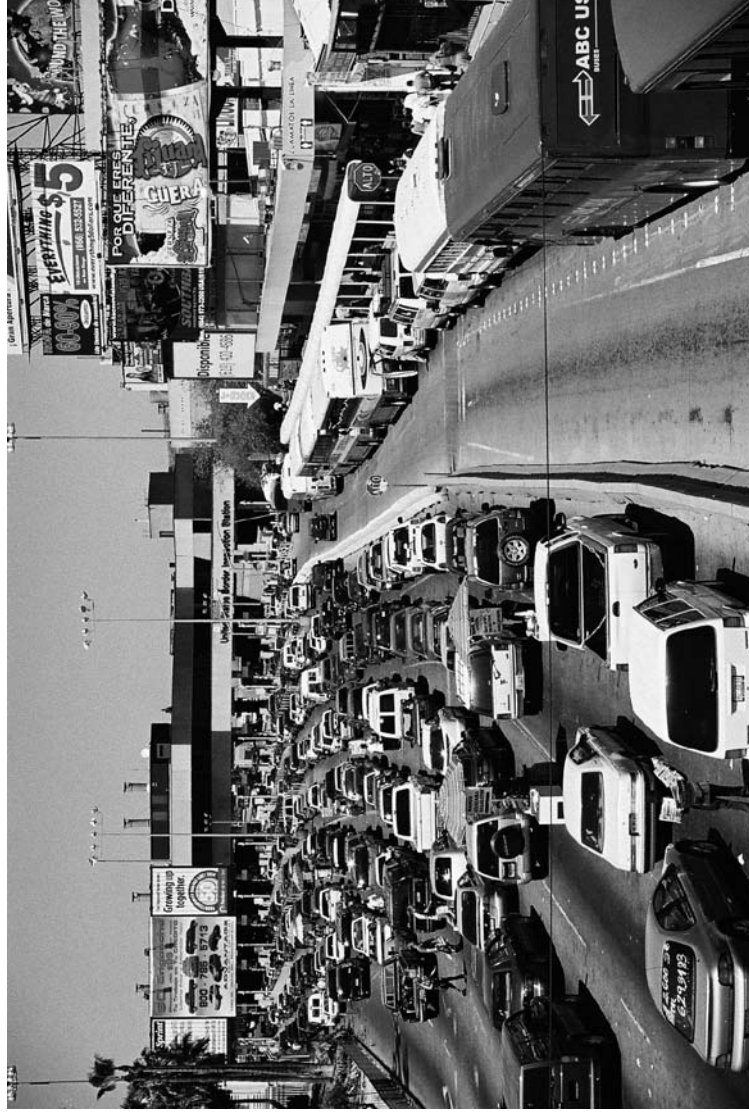
Figura 1. Frontera México-Estados Unidos