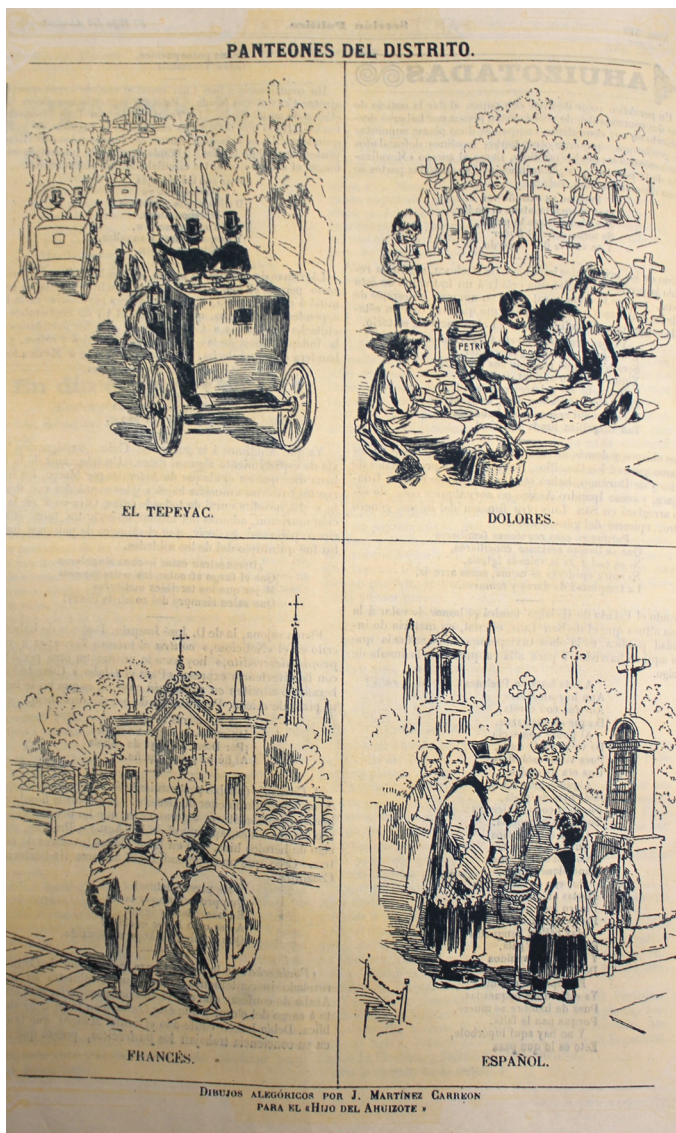
Foto 2. J. Martínez Carreón, Panteones del Distrito. El Hijo del Ahuizote , 1 de noviembre de 1896.