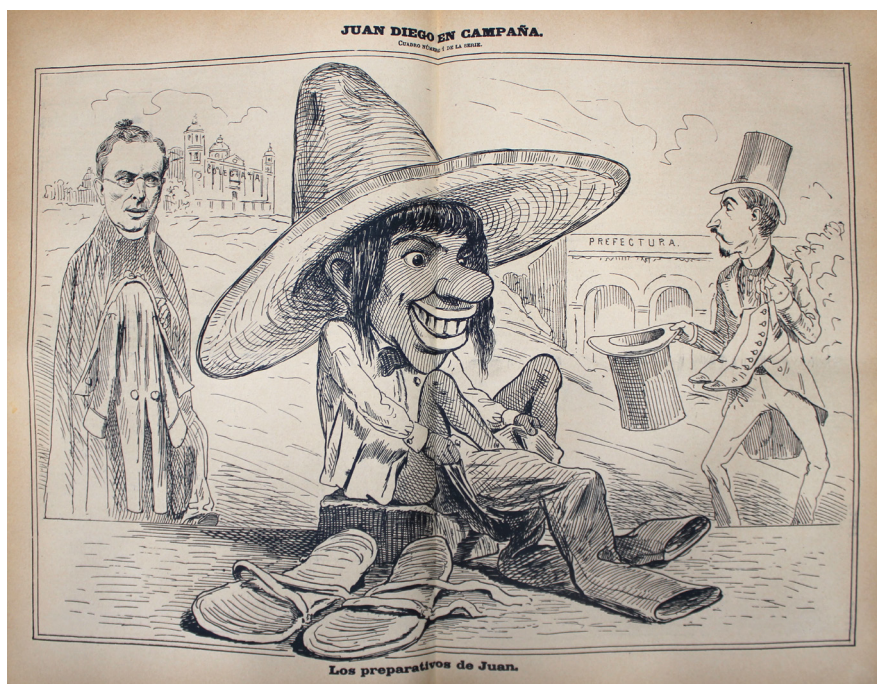
Foto 3. Juan Diego en Campaña. El Hijo del Ahuizote , 29 de septiembre de 1895.

De 1887 a 1895 hubo un notable crecimiento demográfico, aunque los ingresos de la municipalidad permanecieron bajos. En 1886 la población abarcó 5 281 habitantes y en 1895 sumó 16 498. Mientras los ingresos en 1886 contaron $24 901 y en 1895, $28 000 [De la Torre 1887: 7-10; Peñafiel 1898: 45]. Se debe resaltar que la romería del 12 de diciembre resultaba una de las principales fechas para el comercio. No obstante, la muchedumbre produjo problemas de alojamiento y salubridad en tanto los servicios de agua y limpia eran deficientes. Con los años se presentaron enfermedades y riesgos de epidemias porque los peregrinos hacían sus necesidades en los llanos, ríos y zanjas a falta de inodoros [ Diario del Hogar 1895a: 2].