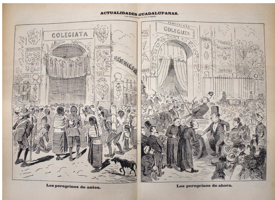
Foto 1. Actualidades Guadalupanas. El Hijo del Ahuizote , 20 de octubre de 1895.

En 1895 El Hijo del Ahuizote publicó la caricatura “Actualidades guadalupanas”, dos escenas dividen la imagen: la primera parte representó a “los peregrinos de antes”, por medio de una procesión de indígenas llegando a la Colegiata en la Villa de Guadalupe. El templo está adornado con guirnaldas de cempasúchil, yolloxochitl y tule. El siguiente panel, en cambio, describió a los “peregrinos de ahora” como una comitiva de aristócratas en carruajes. Mientras tanto, los obispos reciben a un caballero. La iglesia, por su parte, luce perlas, esmeraldas, turquesas, diamantes, brillantes, topacios y rubíes (foto 1).