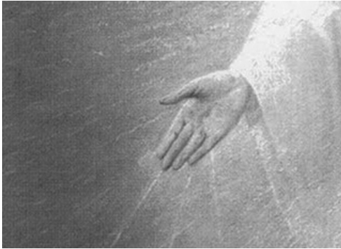
Detalle de manos y pies de Nuestra Señora de Todos los Pueblos.