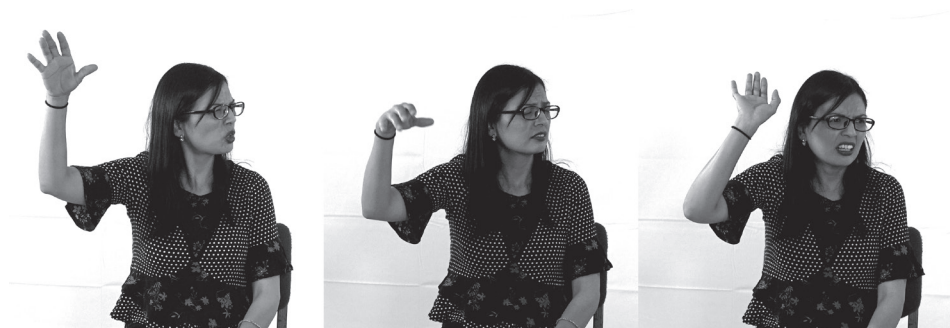
A. 'Así ese era otro país...'