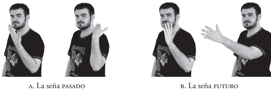
Figura 9. Dos señas temporales déicticas

terminado o que no sabemos si está concluido) o, incluso, las inferencias provenientes de la construcción en su conjunto, apoyen la interpretación temporal de los eventos (en lenguas sin marcación temporal obligatoria), no se considera marcación temporal.