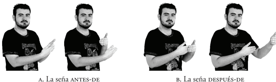
A. La seña ANTES-DE

ser una fecha, como 1950), la mano derecha, en cambio, se mueve, en el plano horizontal o sagital, 14 hacia la izquierda o hacia atrás para expresar que el evento sucedió ‘antes de 1950’ o hacia la derecha o hacia enfrente para expresar que sucedió ‘después de 1950’. En la Figura 10, se muestra un señante zurdo que prefiere utilizar el plano sagital, su mano de referencia (la que representa la fecha, por ejemplo) es la derecha, la izquierda se mueve hacia atrás en la seña ANTES-DE (un intervalo anterior, de pasado, con respecto al referente temporal). Por el contrario, se mueve hacia enfrente en la seña DESPUÉS-DE.