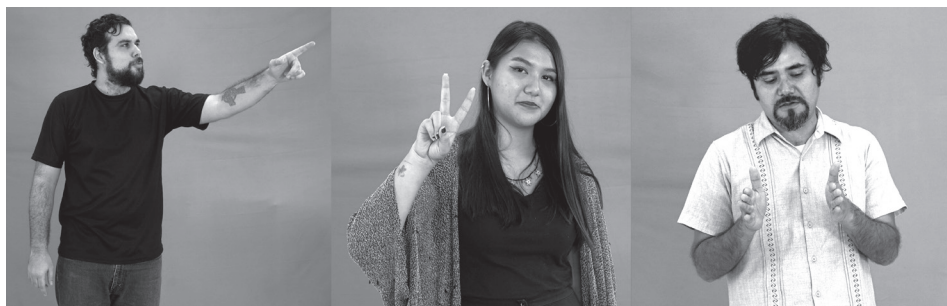
A. Un gesto de señalamiento

hablantes usan regularmente para que sea interpretada de una manera relativamente predecible. Sin embargo, la convencionalidad no implica que la forma deba ser discreta ni tampoco arbitraria. Buena parte de los gestos que utilizamos cotidianamente son altamente convencionales pero graduales y motivados (icónica o metafóricamente). Por otro lado, el que sean convencionales también les impone restricciones para su uso y su forma: el gesto de “amor y paz” debe tener los dedos índice y medio extendidos y separados entre sí, mientras que el pulgar debe sostener a los dedos anular y meñique presionando, con su yema, sobre ellos (ver Figura 7b). Cualquier versión que fuera distinta en estos parámetros articulatorios sería juzgada como ‘rara’ o ‘inadecuada’.