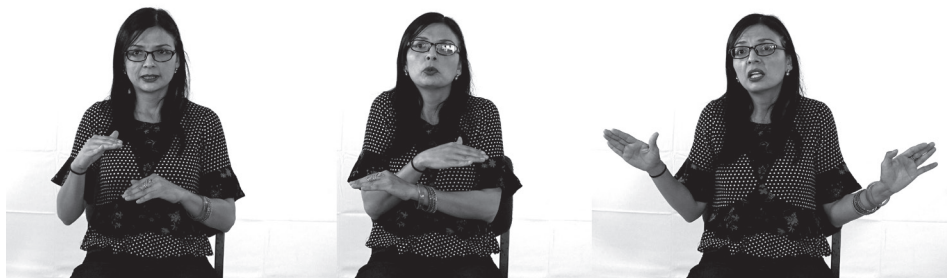
A. ‘Era como empezaba ...’

toda la comida. A la oración ‘Después ya se terminaba la venta...’, la acompaña un gesto representativo (también hecho con las dos manos) que indica el FIN del intervalo temporal del evento de la venta de comida .