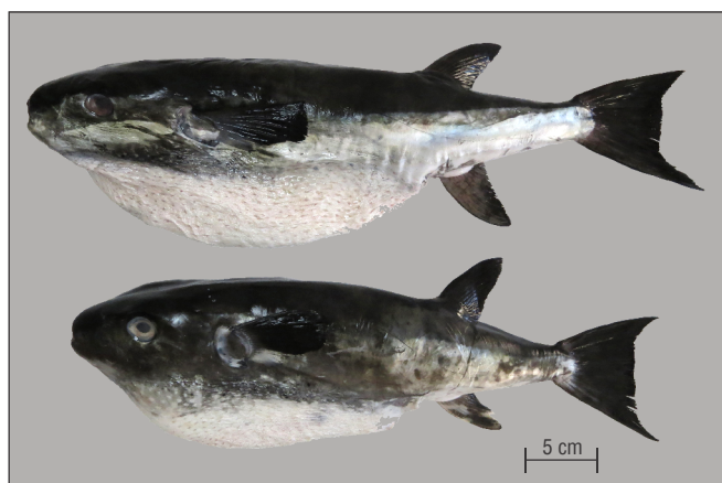
Figure 2. Lagocephalus lagocephalus specimens caught in the southwestern Gulf of Mexico (CIFI record No. 1780, 360–398 mm standard length), Veracruz, Mexico.

During the catch and handling of the 3 specimens (CIFI registration No. 1925) caught on 17 December 2021, 2 males and 1 female, we observed the release of gametes. The GSI was high in each case: 3.63, 4.39, and 5.68. Testicles