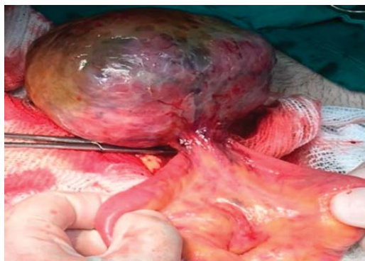
Figura 2: Se observan los vasos mesentéricos nutricios que cruzan el ileon hacia el tumor.

Otros factores serían los subtipos histológicos, el grado de pleomorfismo celular y la edad del paciente; con el tumor localizado en bajo riesgo, la resección quirúrgica sería suficiente, sin embargo, en el resto se recomienda el tratamiento adyuvante para impedir la acción del receptor KIT, así como detener la división celular y evitar su diseminación. 7-11 Aunque en nuestro caso se trataba de una enfermedad oncológica localizada sin extensión a otros órganos y se realizó una resección quirúrgica local con buen