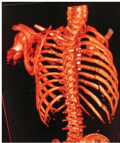
Figura 2: Fracturas costales múltiples por trauma contuso, tercera a décima costillas hemitórax derecho. Tomografía con reconstrucción ósea.

seis accidentes automovilísticos, dos de moto y cuatro caídas (de su propia altura, 10 y 25 m), con un rango de costillas fracturadas de tres a 10 y un promedio de seis. La intensidad del traumatismo se graduó mediante la escala combinada de trauma score y con el índice de severidad de las lesiones (TRISS) de la Asociación Americana de Cirugía de Trauma con un rango de 1.1 a 49.7, una media de 11.71 y una desviación estándar de 13.12 puntos. Se calificó a los pacientes con trauma contuso como severo utilizando estas escalas de 1 a 12 (8.3%).