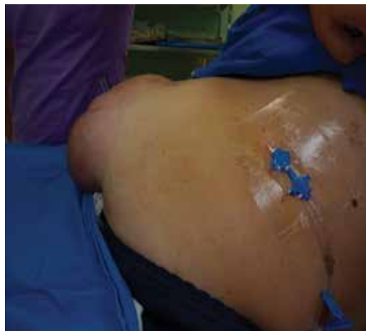
Figura 3: Paciente con hernia gigante posterior a la colocación del catéter doble lumen.

En nuestra serie, los pacientes con pérdida de dominio presentaban clínicamente sacos herniarios gigantes, con cambios cutáneos como adelgazamiento de la piel, cambios en la coloración y úlceras 8 (Figura 3). A la manipulación había imposibilidad para la reducción del contenido herniario. Mediante apoyo con imágenes de tomografía, se midió y comparó el tamaño de la cavidad abdominal y el del