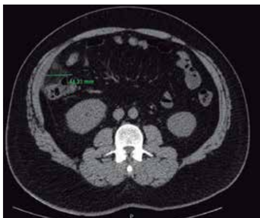
Figura 1. Tomografía axial simple con patrón de estrías hiperdensas, concéntricas, en el flanco derecho.