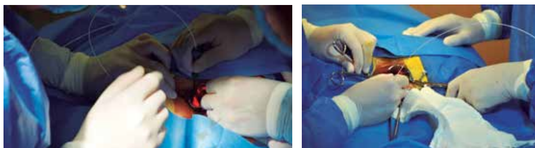
Figura 4. Hemorroidectomía láser (HLP: hemorrhoidectomy laser procedure).