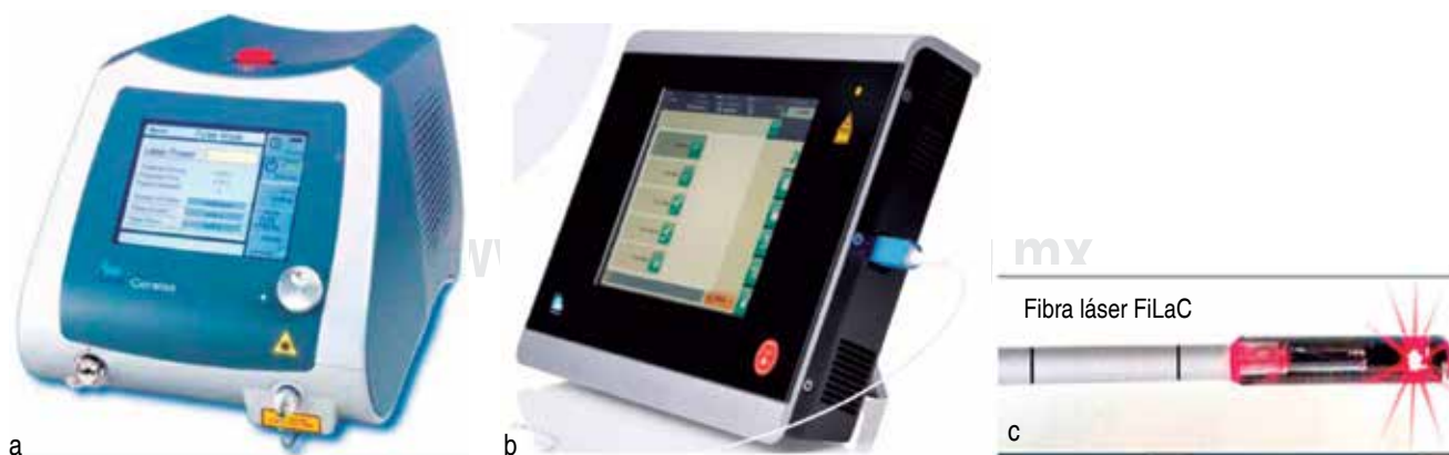
Figura 1. Láser Diodo Ceralas a) , y Leonardo Biolitec® b) , junto con fibra óptica FiLaC® c).

Los datos demográficos se obtuvieron durante el interrogatorio en la primera consulta de valoración preoperatoria y se concentraron en una base de datos que concentraba las variables; se validó su contenido y se les sometió a análisis mediante el programa SPSS versión 22 (IBM Software, Chicago, IL). Se expresaron los resultados mediante estadística descriptiva.