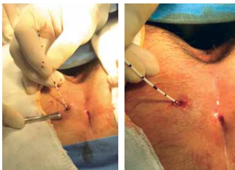
Figura 5. Cierre con láser del sinus pilonidal.

reportaron cambios en la continencia durante el seguimiento postoperatorio.