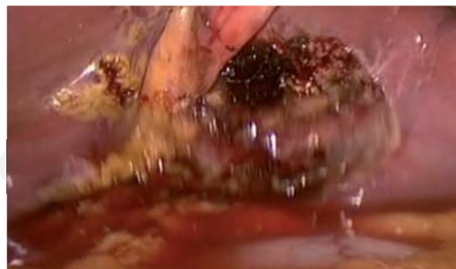
Figura 3. Foto que en la que se aprecia el lecho vesicular posterior a colecistectomía; confirmando la relación anatómica descrita con anterioridad.