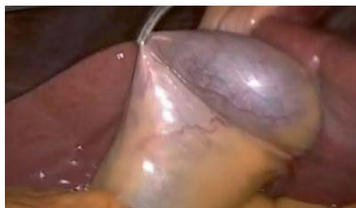
Figura 1. En esta foto se observa implantación de la vesícula biliar en el segmento III hepático y del lado izquierdo del ligamento suspensorio.

durante el transcurso de la cirugía se identifica vesícula biliar siniestra, localizada en el segmento III hepático, del lado izquierdo del ligamento suspensorio hepático ( Figuras 1 a 3 ). Se decide no agregar trocares auxiliares, llevando a cabo colecistectomía con colocación de puertos de forma convencional identificando las diversas