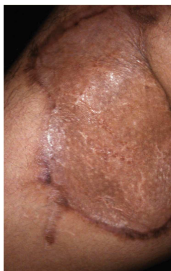
Figura 4 Mismo paciente a los 2 meses del tratamiento.