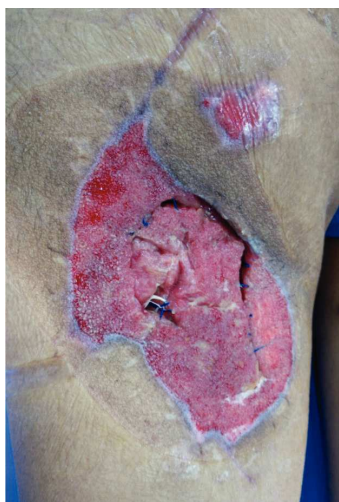
Figura 3 Mismo paciente manejado con desbridamiento quirúrgico, terapia V.A.C.® durante 2 semanas y posteriormente aplicación de Alloderm®