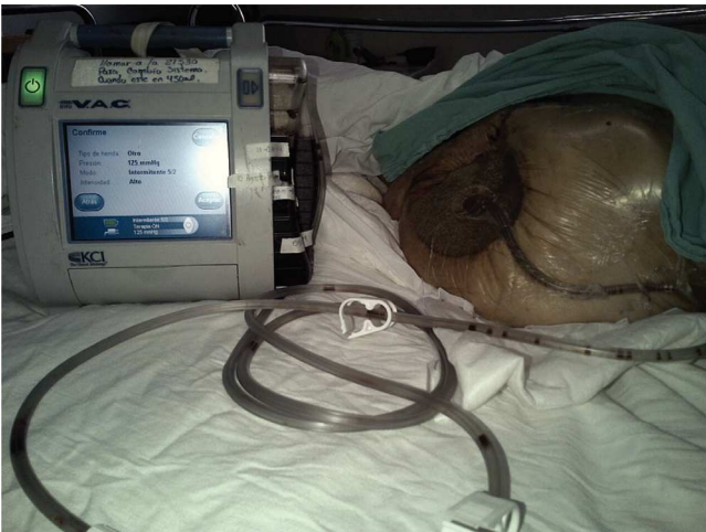
Figura 1 Terapia de presión negativa con sistema V.A.C. (Vacuum Assisted Closure) (KCI Co. U.S.A.)

La terapia de presión negativa se puede aplicar en cualquier tejido siempre y cuando esté bien vascularizado (ya que la necrosis puede ocurrir cuando se aplica en heridas isquémicas 14 ) y que la herida este libre de tejido necrótico. Las contraindicaciones son pocas pero se deben tomar en cuenta, destacan las siguientes: heridas con tejido necrótico, osteomielitis no tratada, fístulas, malignidad, aplicar directamente la esponja sobre arterias y venas expuestas. 7,15