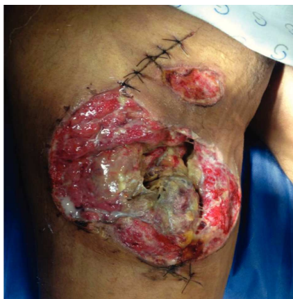
Figura 2 Paciente masculino de 23 años de edad con herida por arma de fuego en miembro pélvico derecho