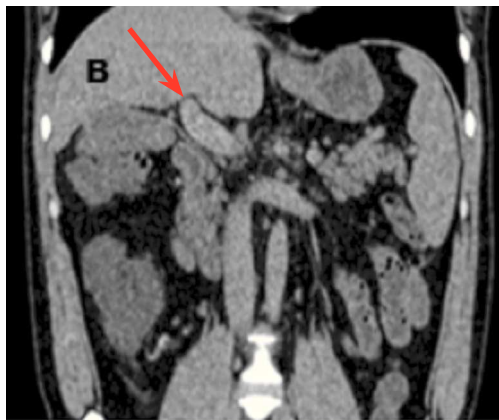
Figura 3 Angiotomografía en donde se observa vena porta re-canalizada con defectos de perfusión en su interior compatibles con degeneración cavernomatosa. (flecha)

Se retiró el catéter vascular y se suspendió la infusión de trombolítico y heparina para continuar tratamiento con Enoxaparina a dosis de 60 mg por vía subcutánea cada 12 h. El estudio histopatológico de la pieza quirúrgica reportó pared de intestino delgado con necrosis isquémica panmural y trombosis reciente en vasos mesentéricos (fig. 2). Se realizó TAC de control en donde se observaron cambios compatibles con transformación cavernomatosa de la vena porta (fig. 3). Los resultados del perfil inmunológico y la determinación de proteína C, S y Antitrombina III, fueron normales o negativos. La evolución del enfermo fue adecuada por lo que fue dado de alta con tratamiento a base de anticoagulantes orales.