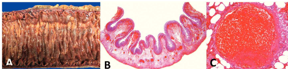
Figura 2 Estudio histopatológico de pieza reseçada en donde se observa. A) Imagen macroscópica intestino delgado edematoso y de aspecto necro-hemorrágico. B) Pared de intestino delgado en donde se observa hemorragia en vellosidades, edema y múltiples trombos. C) Vaso sanguíneo con trombo.

Se retiró el catéter vascular y se suspendió la infusión de trombolítico y heparina para continuar tratamiento con Enoxaparina a dosis de 60 mg por vía subcutánea cada 12 h. El estudio histopatológico de la pieza quirúrgica reportó pared de intestino delgado con necrosis isquémica panmural y trombosis reciente en vasos mesentéricos (fig. 2). Se realizó TAC de control en donde se observaron cambios compatibles con transformación cavernomatosa de la vena porta (fig. 3). Los resultados del perfil inmunológico y la determinación de proteína C, S y Antitrombina III, fueron normales o negativos. La evolución del enfermo fue adecuada por lo que fue dado de alta con tratamiento a base de anticoagulantes orales.