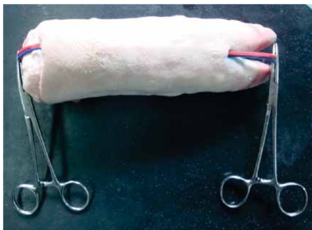
Fig. 1. Ejemplifica la preparación del modelo biológico no vivo con los tubos de Silastic® subcutáneos que simulan la vena y la arteria.

Otro de los objetivos es que el alumno identifique adecuadamente el material y equipo para realizar el procedimiento de venodisección. El equipo incluye: gorro, cubreboca, bata y guantes, que deben estar estériles, lámpara quirúrgica o de chicote, solución estéril, antiséptico (yodopovidona), anestésico local (lidocaína simple al 1 o 2%), 2 jeringas de 5 ml, campos quirúrgicos estériles, catéter largo de poliuretano o Silastic®, cinta adhesiva plástica y gasas estériles.