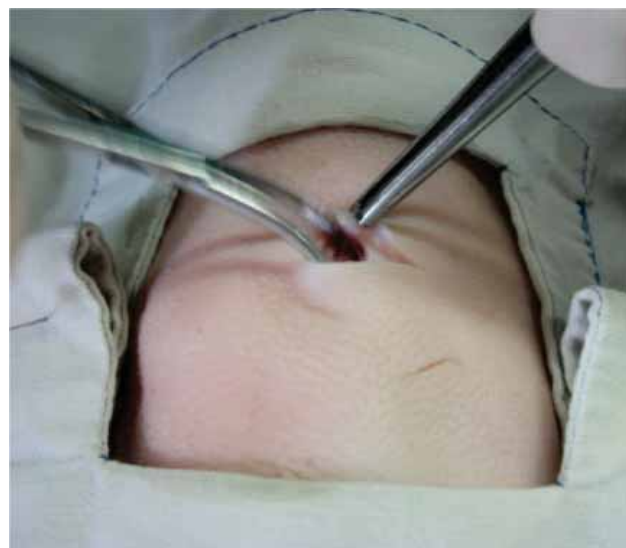
Fig. 3. Muestra cómo se realiza la disección roma del tejido subcutáneo con pinzas Halsted.