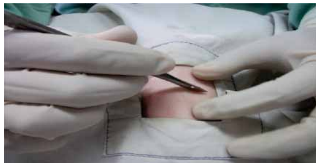
Fig. 2. Se muestra cómo se realiza la incisión en piel.