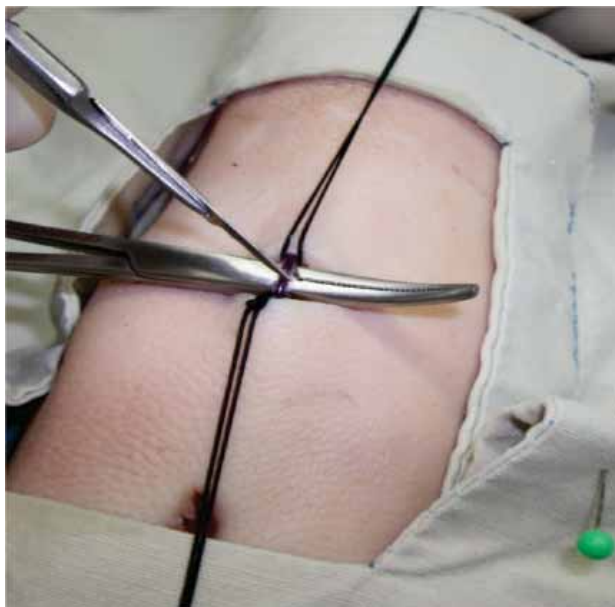
Fig. 5. Procedimiento para realizar una pequeña incisión sobre la vena.

un procedimiento tal en las salas de urgencias o donde se requiera. 7