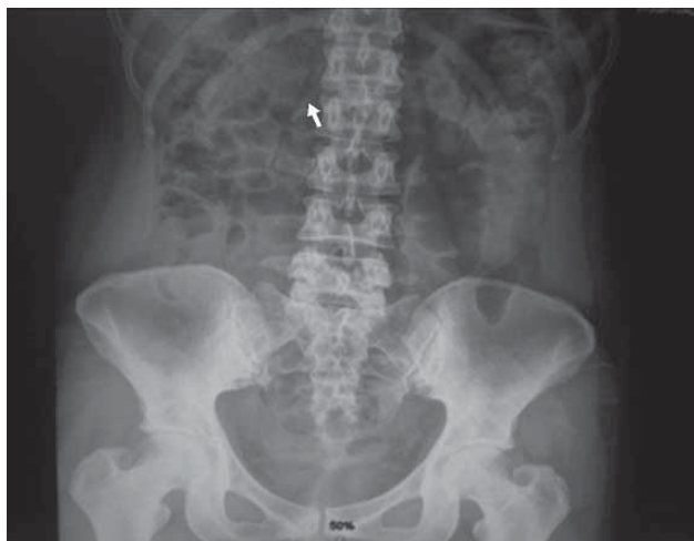
Fig. 1. Radiografía simple prequirúrgica del abdomen.