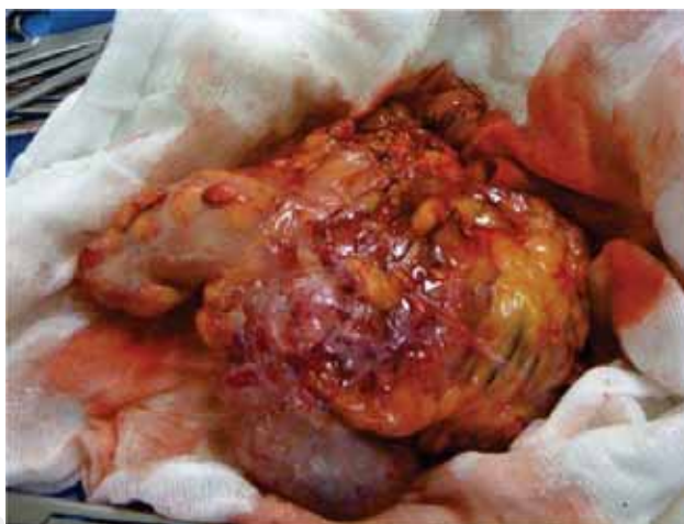
Fig. 4. Apéndice reseada y enviada a estudio histopatológico.

derecho, en la cual el reporte histopatológico fue sólo de inflamación. El caso que nosotros reportamos tuvo un solo episodio de dolor, y las características clínicas y radiológicas nos orientaban a una apendicitis aguda, no encontrando sintomatología de enfermedad de Crohn. Farooq et al. 8 comentan que el diagnóstico prequirúrgico de apendicitis de Crohn es difícil, pero debe ser