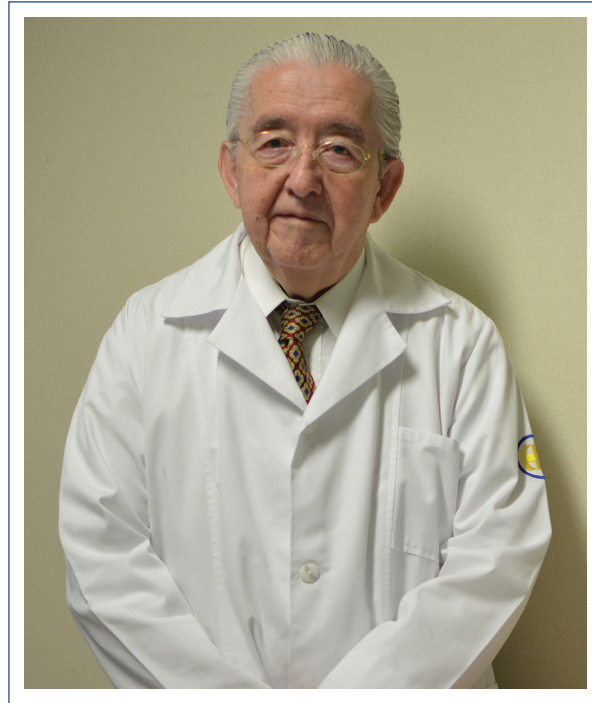
Figura 1. Fungió como Jefe del Departamento de Evaluación y Análisis de Medicamentos de la Dirección de Investigación del Hospital Infantil de México Federico Gómez desde 2007, donde también se desempeñó como Presidente del Comité de Ética en Investigación.

Su actividad laboral y académica fue reconocida, lo que le permitió ingresar a la Academia Nacional de Medicina y la Academia Mexicana de Pediatría, y ser miembro honorífico de varias sociedades de pediatría y neonatología tanto en México como en el extranjero (Figura 3).