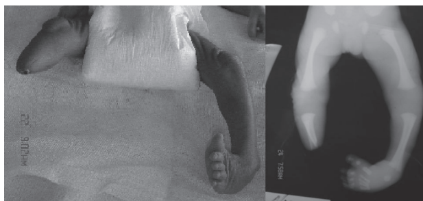
Figura 2. Amputación del miembro inferior derecho (distal a rodilla) y pie equino varo izquierdo.