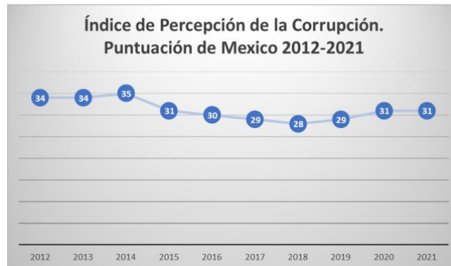
Gráfico 1. IPC México 2012-2021

Fuente: Elaboración propia con datos de los informes anuales de Transparencia Internacional. https://www.transparency.org/en/cpi/2021 .