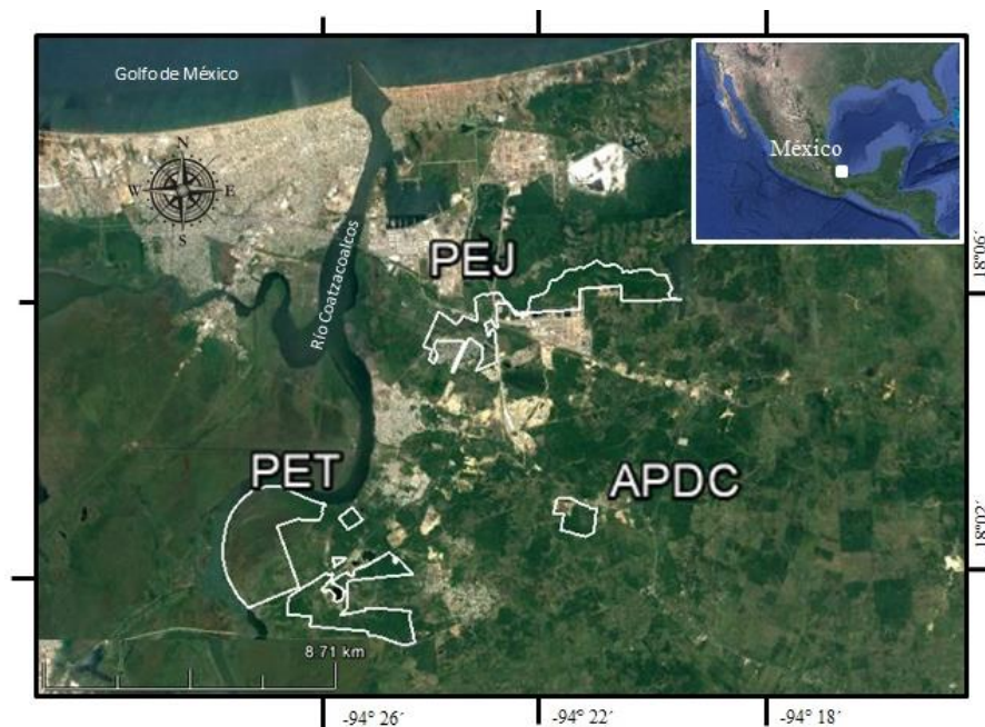
Figura 1. Ubicación del Área de Protección y Desarrollo de Ceratozamia (APDC), el Parque Ecológico Jaguaroundi (PEJ) y el Parque Ecológico Tuzandepetl (PET), en el sur de Veracruz, México. Las líneas blancas representan los polígonos de cada una de las áreas protegidas.

de 100 hectáreas, de las cuales 50 ha corresponden a un área abierta dominada por pasto inducido para la ganadería y otras 50 ha corresponden a bosque tropical subcaducifolio conservado. La zona de pastizal está dominada por pastos inducidos para la ganadería ( Paspalum fasciculatum y Setaria geniculata ), con algunos árboles aislados ( Coccoloba hondurencis ), algunas palmas ( Attalea liebmanni ) y con cercas vivas compuestas por C. hondurencis , Guazuma ulmifolia , Bursera simaruba y Gliciridia sepium . El área de remanentes de bosque tropical subcaducifolio tiene un estrato arbóreo con una altura máxima de 25 m, donde las especies más representativas son Miconia argentea , Guazuma ulmifolia , Cupania dentata , C. hondurencis , Bursera simaruba , Enterolobium cyclocarpum , Cecropia obtusifolia , Vochysia hondurencis , Pithecellobium lanceolatum . En el estrato arbóreo bajo, las especies dominantes son Tabernaemontana alba y Dendropanax arboreus .