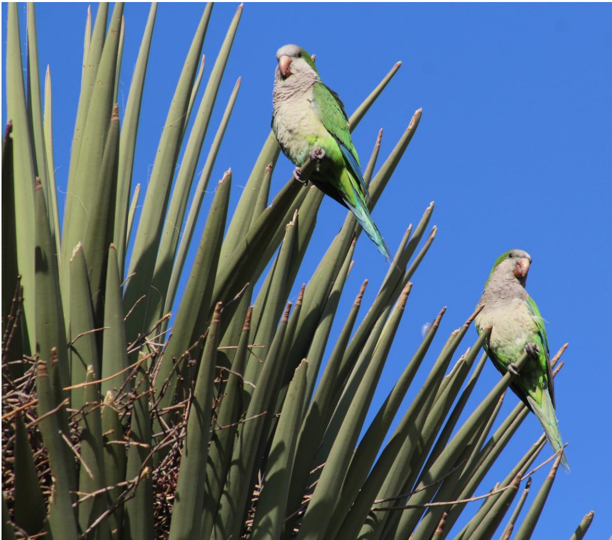
Figura 1B. Individuos de cotorra argentina en una yuca ( Yucca filifera ) con nido.

Los sitios de presencia de individuos de la especie, así como de nidos fueron georreferenciados y documentados fotográficamente.