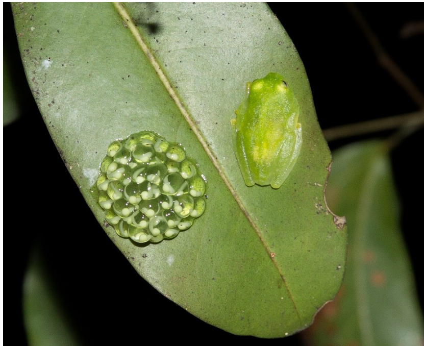
Figura 2. Individuo adulto de Hyalinobatrachium fleischmanni protegiendo ovipostura en el Área Natural Bosque de Cinquera, municipio de Cinquera, Departamento de Cabañas, El Salvador.