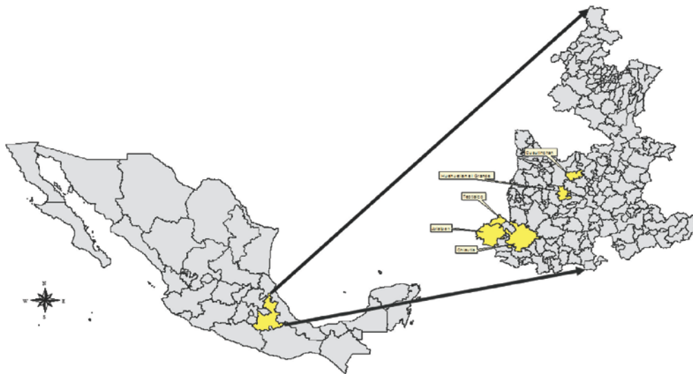
Figura 1. Ubicación de los municipios de estudio.

Área de estudio. La Mixteca poblana es una región de tipo étnico, que pertenece a la cuenca del río Balsas, al sur del estado de Puebla. El área de estudio representa una superficie de 2019 km 2 de la región y comprendió los municipios de Cuautinchán, Chiautla, Huehuetlán el Chico, Huehuetlán el Grande, Jolalpan y Teotlalco (Fig. 1); éstos se eligieron porque sus pobladores se mostraron más receptivos a ser entrevistados.