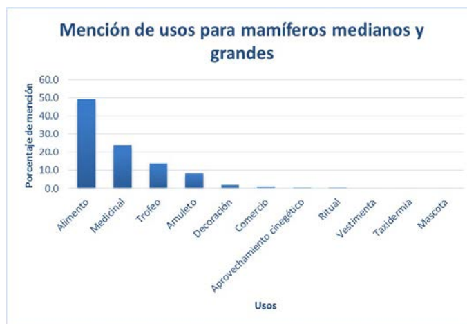
Figura 2. Porcentaje de mención de los usos de mamíferos silvestres.

Se aprovechan 15 especies de mamíferos silvestres con 11 categorías de uso, resultando la de alimento como la más importante, seguida del uso medicinal (Fig. 2).