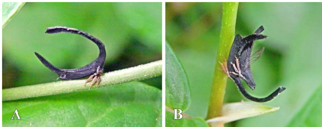
Figura 2. Cladonota apicalis : A) Hembra sobre Piper hispidum ; B) Adultos apareándose sobre P. hispidum (el macho perdió las prolongaciones del pronoto).