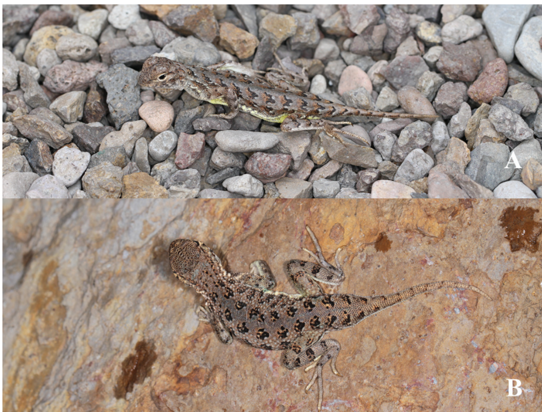
Figura 1. Holbrookia approximans . Ejemplar hembra de El Llano, Aguascalientes, México (A) y ejemplar macho de Pinos, Zacatecas, México (B).

Aquí reportamos un ejemplar hembra de Holbrookia approximans que pesó 2.5 g., midió 48.3 mm de L. H. C. y 78 mm de longitud total, con 11 y 13 poros femorales a cada lado (Fig. 1-A). Fue recolectada el 15 de junio de 2015, muy cerca a la Comunidad Las Negritas, El Llano, Aguascalientes (21.991147°N, -101.872101°O; WGS84) a una altitud de 2130 m. El individuo se observó a las 12:20 h en una zona con poca pendiente, dominada por herbáceas de poca altura, caminando sobre una terracería con abundantes rocas, y al verse descubierto, corrió sobre el camino y se ocultó bajo un pequeño arbusto de Mimosa sp. (garruño), en los alrededores se localizaron zacates del género Bouteloua spp., plantas de Dodonea viscosa (jari-