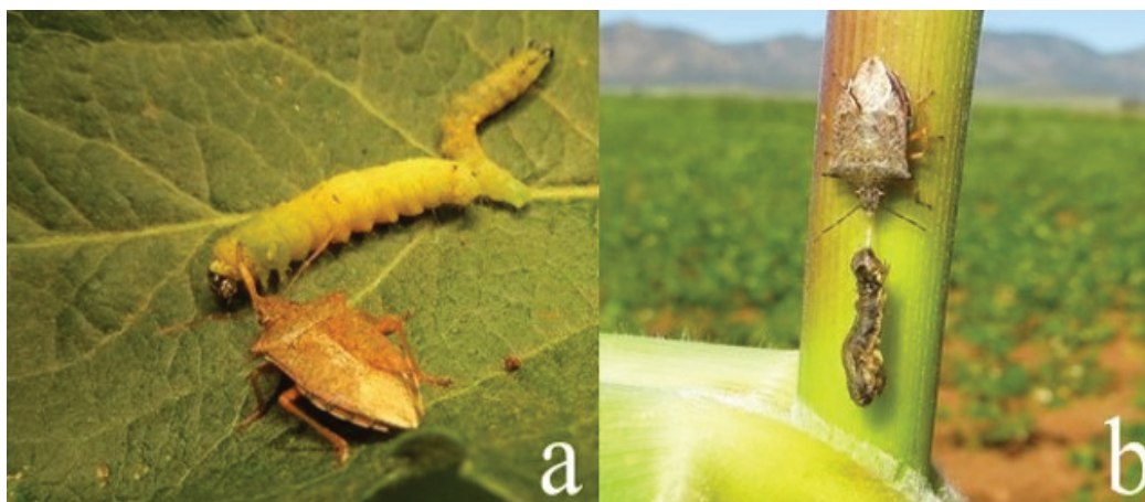
Figura 1. Adultos de Podisus maculiventris , alimentándose de larvas de; a) C. rosaceana y b) S. frugiperda .

La ausencia de parasitoides en las larvas de C. rosaceana , se debió posiblemente a que esta plaga es de reciente aparición en el país, reportada por Bautista-Martínez et al. (2011), aunado a la poca diversidad vegetal cercana al huerto de manzano (Unruh et al. 2012). Sin embargo, se encontró a P. maculiventris depredando de manera na-