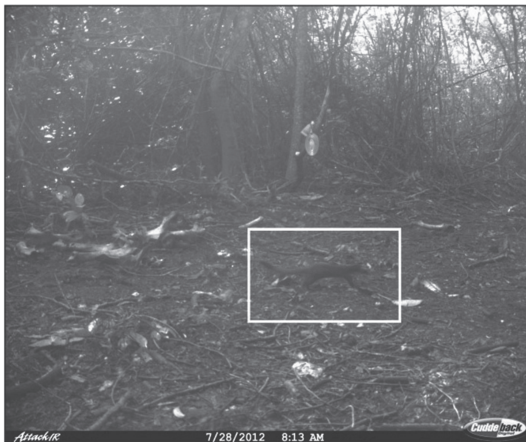
Figura 2. Fotografía de comadreja ( Mustela frenata ) obtenida por medio de una trampa cámara en la región centro-oeste del estado de Campeche, México.

Las fotografías confirman por primera vez la presencia de la comadreja en Campeche, la cual había sido considerada como posible (Guzmán-Soriano et al. 2013b, Vargas-Contreras et al. 2014) pero sin existir confirmación (Guzmán-Soriano et al. 2013a, Sosa-Escalante et al. 2013). La falta de observaciones previas de comadrejas