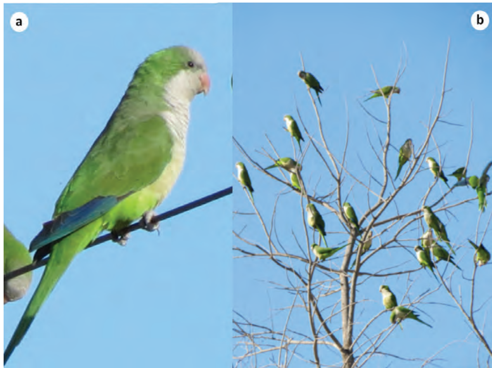
Figura 1. (a) Individuo de cotorra argentina perchado en cables eléctricos. (b) Individuos de cotorra argentina perchados en pino salado ( Tamarix spp.). Fotografiados en Chametla, B.C.S.

daños en cultivos anuales (maíz, sorgo, girasol) y árboles frutales (lichi, ojo de dragón, durazno, pera, manzana y cítricos, entre otros) (Freeland 1973, Mott 1973, Tillman et al. 2000, Domenech et al. 2003, Pablo-López 2009); también causa daños a la infraestructura urbana cuando construyen los nidos en subestaciones, torres y postes eléctricos, pudiendo provocar averías al sistema eléctrico (Avery et al. 2006, Pruett-Jones et al. 2007). En el estado de Florida han encontrado que la cotorra argentina causa daños a las huertas con pérdidas millonarias anuales (Tillman et al. 2000). En Cataluña, la especie se ha expandido y ha colonizado algunas zonas de importancia agrícola (Domenech et al. 2003). En México, se ha reportado su presencia en cultivos de sorgo y maíz en el estado de Oaxaca (Pablo-López 2009), pero no se ha hecho una valoración económica de sus efectos.