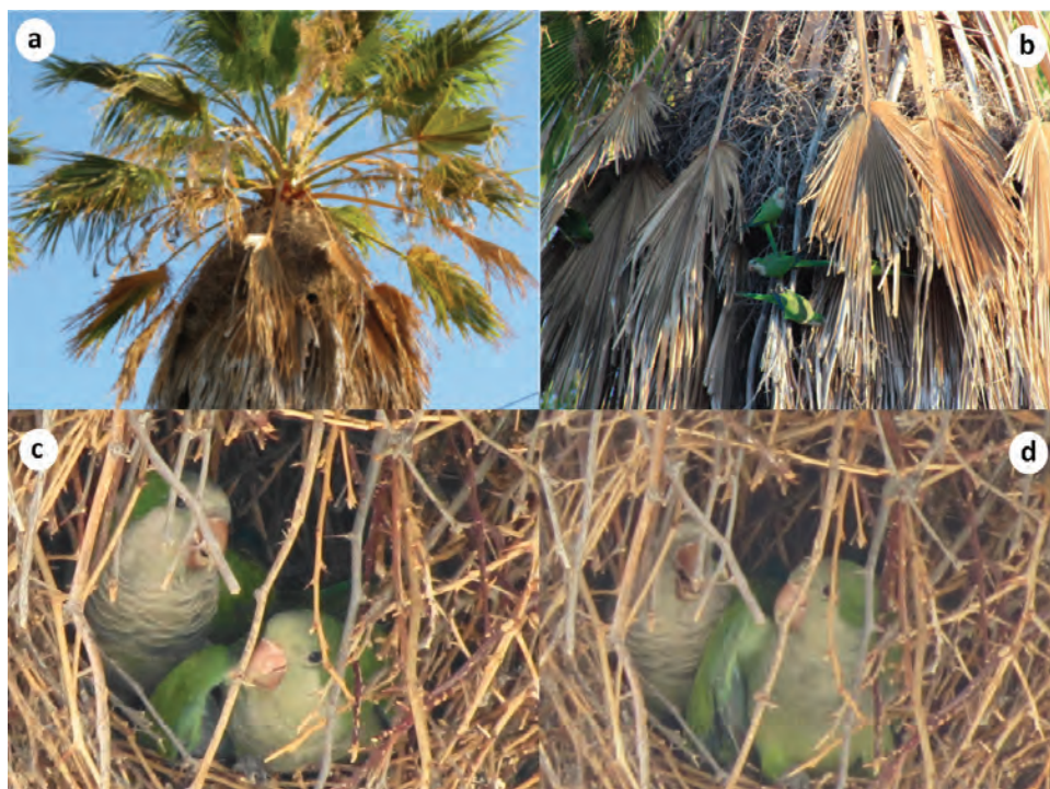
Figura 3. Nidos e individuos de cotorra argentina. (a) Nido construido en palma de abanico. (b) Adultos ingresando a los nidos. (c) Adulto y pollo dentro del nido. Nótese el color del plumaje del pollo, verde oliva sobre frente y pecho, a diferencia del adulto. (d) Pollo en nido demandando alimento (agitando las alas) a su progenitor que estaba a su lado.