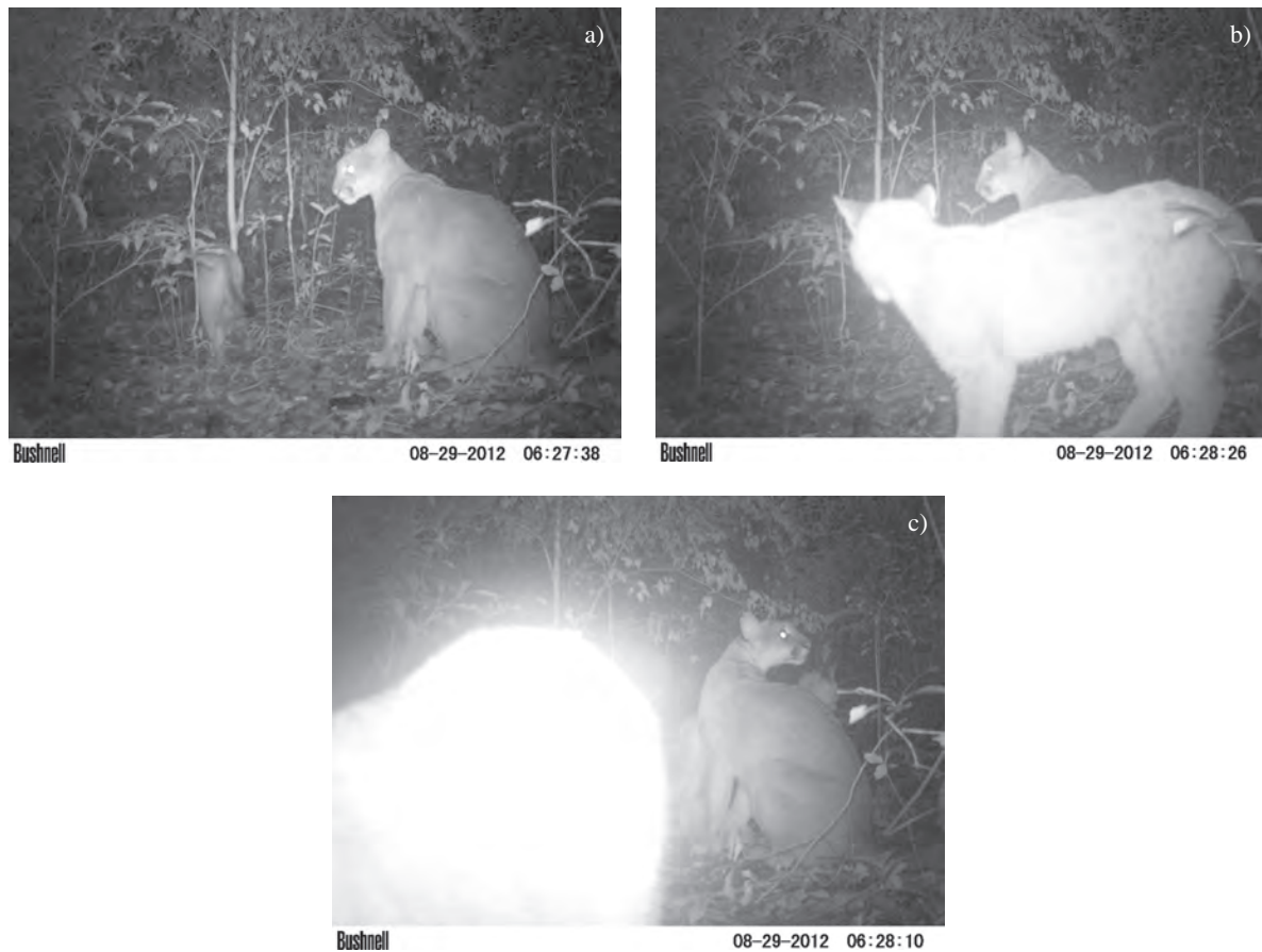
Figura 2. a, b e c - Registro fotográfico de Puma concolor na Floresta Nacional de Piraí do Sul no estado do Paraná, Brasil.

de Piraí do Sul. A presença destas espécies levanta a possibilidade da criação de um corredor biológico, pois área de estudo corresponde a uma importante região, fazendo conexão entre as áreas florestadas da empresa Iguazu S/A e pequenas fazendas com gado e agricultura no entorno. Estudos direcionados para distribuição dos felinos são poucos, por isso considera-se necessário visto que espécies anteriormente registradas em áreas próximas por Vidolin & Góss Braga (2004) e Moro (2007) como Panthera onca não foi registrada neste estudo. Manter suas populações é extremamente importante, especialmente aqueles que estão sob ameaça de extinção, reforçando a necessidade premente de ações e estratégias em prol de sua conservação, podendo estes dados servir como base para elaboração de políticas públicas visando à proteção da biodiversidade da mastofauna ameaçada no Plano de manejo Da Unidade.