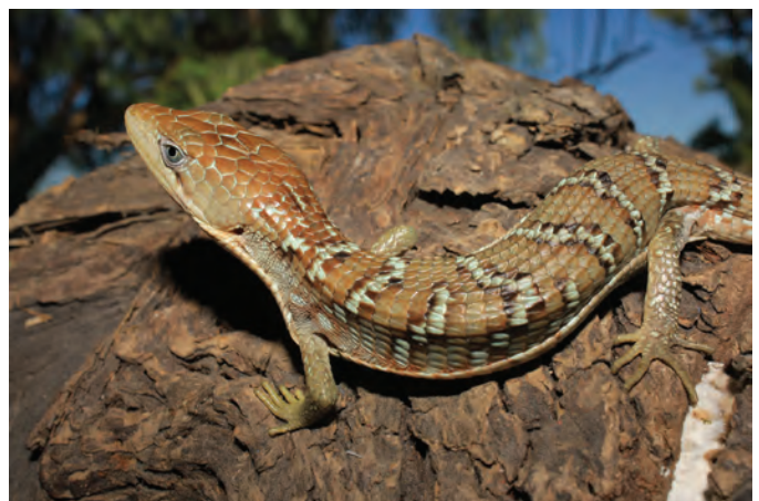
Figura 1. Gerrhonotus infernalis (ENCB-18788) colectado en Mineral de Pozos Guanajuato.

Además del ejemplar ENCB 18788, fueron encontrados mediante la búsqueda en bases de datos otros dos registros (MNHN-5140; KU-33587) procedentes de la Sierra Gorda de Guanajuato, pertenecientes a la localidad de El Río Álamos Cañón Mulato, Las Margaritas; de los