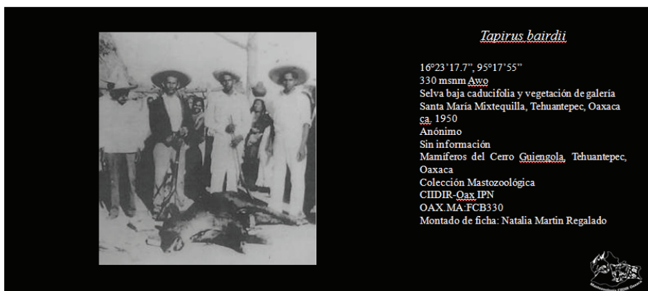
Figura 1. Fotocolecta de tapir centroamericano Tapirus bairdii en el Istmo de Tehuantepec, Oaxaca, México (ca. 1950).

El registro obtenido se encuentra a 40.4 km al suroeste del registro histórico más cercano en La Ventosa (March 1994). La procedencia del ejemplar probablemente corresponde, al igual que otros registros históricos, a alguna población que pudo haber existido en la Planicie costera del Istmo de Tehuantepec (Lira et al. 2006) o posiblemente se trata de animales cuyo origen es la región de Los Chimalapas y que se desplazaron a esta zona por la persecución de cazadores o incendios (Delfin-Alfonso et al. 2008), o quizá se trate de animales que se desplazan a nuevas áreas en