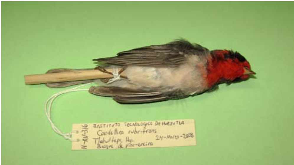
Figura 8. Cardellina rubrifrons . Tlahuiltepa, Tlahuiltepa, Hidalgo.

esto está ligado a los sitios en donde se enfocaron nuestros esfuerzos de muestreo, pero aun así, enfatiza la necesidad de intensificar los estudios en estas zonas de Hidalgo parcialmente conocidas. Catorce de estos nuevos registros corresponden a especies migratorias; sin embargo, en general incluyen pocos individuos. En el caso de las especies Egretta rufescens , Grus canadensis , Limosa haemastica , Legatus leucophaeus , Vireo flavifrons , Catharus fuscescens , Vermivora cyanoptera , Setophaga castanea , Geothlypis philadelphia y Cardellina rubrifrons las registramos en los límites de su distribución durante sus movimientos migratorios o incluso fuera de ellos (Howell & Webb 2005; Sibley 2000). Las familias con más registros nuevos para la avifauna del estado fueron Scolopacidae (4 especies) y Parulidae (4 especies).