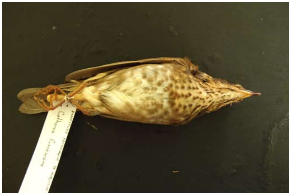
Figura 7. Catharus fuscescens . Tamala, Tepehuacán de Guerrero, Hidalgo.

Geothlypis philadelphia . El 7 de marzo de 2010, a 2 km al sureste de la comunidad de Yahualica, municipio de Yahualica (20°56'57" N, 98°22'55" O; 660 msnm), observamos, a 5 m de altura, una hembra y un macho forrajeando en un árbol de chaca ( Bursera simaruba ) junto con una parvada mixta de parúlidos.