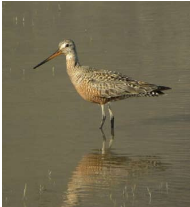
Figura 5. Limosa haemastica . Laguna de Metztlán, Hidalgo.

Sterna forsteri . El 29 de abril de 2010, observamos, durante 45 minutos, un individuo sobrevolando y lanzándose en picada en aguas someras de la Laguna de Metztlán (20°41'03" N, 98°50'34" O; 1253 msnm). Al aproximarse al sitio de observación, fue posible distinguir su pico delgado de color naranja y punta negra, las puntas de las alas plateadas, además de que su cola era notoriamente larga y bifurcada.