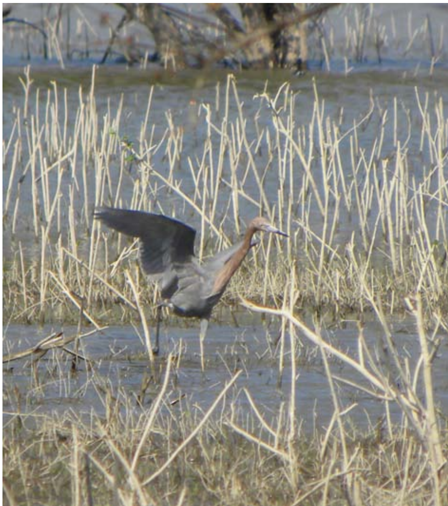
Figura 2. Egretta rufescens . Laguna de Metztlán, Hidalgo (foto: Ma. Eugenia Mendiola-González).

15 m. Adicionalmente, el 17 de noviembre de 2008, colectamos un adulto (H-AV-347) en el río San Pedro, a 250 m al noreste de la localidad de San Felipe Orizatlán (21°10'35" N, 98°36'06" O; 164 msnm). Este individuo se encontraba perchando junto a seis individuos de Egretta thula en un árbol de sabino.