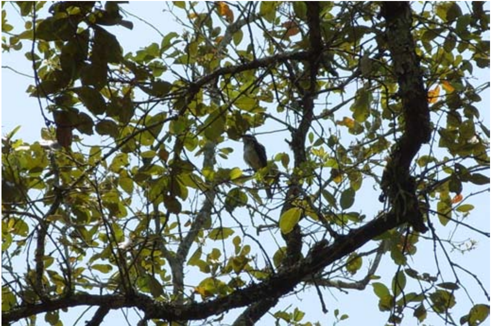
Figura 6. Legatus leucophaius . Huexotitla, San Felipe Orizatlán, Hidalgo.

Las características morfológicas del espécimen concuerdan con las de la subespecie C. f. salicicola (Pyle 1997; Garrido & Rodríguez 1999; Sibley 2000; National Geographic Society 2002; Andersen et al. 2007).