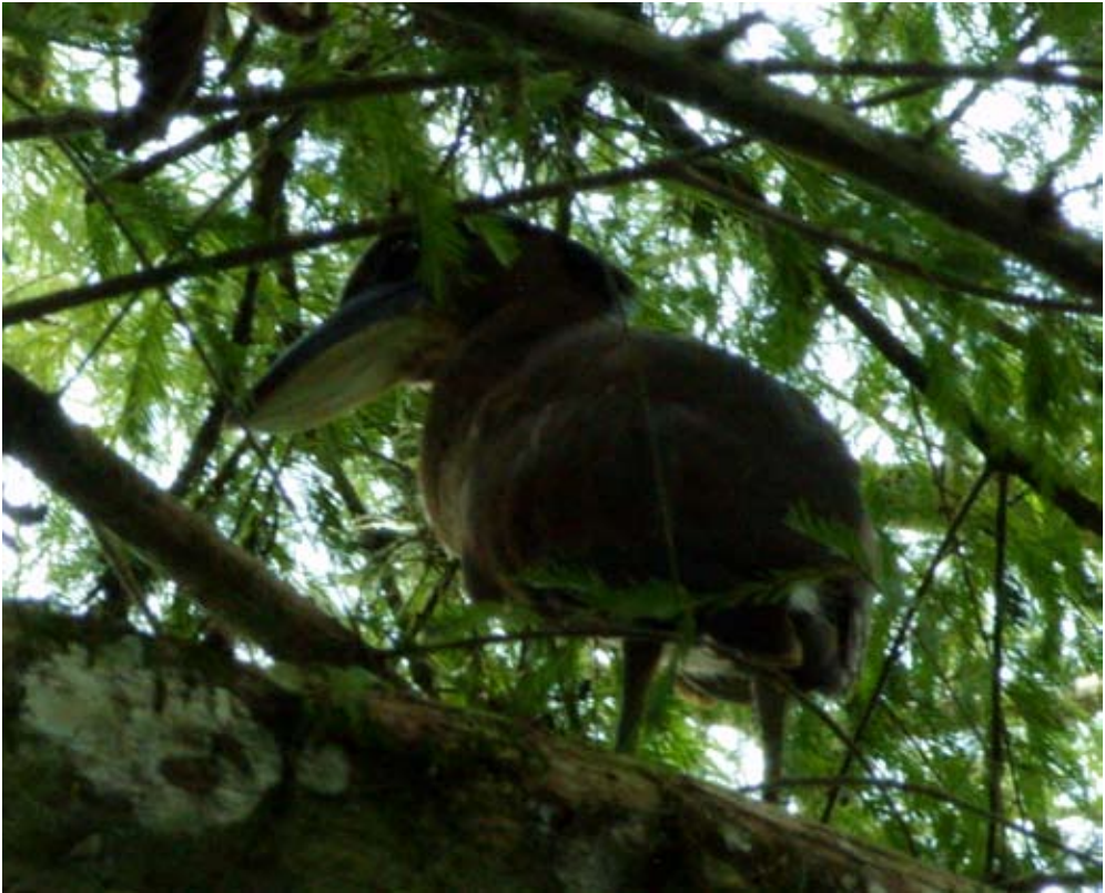
Figura 3. Cochlearius cochlearius juvenil. Santo Domingo, San Felipe Orizatlán, Hidalgo.

de agua de la Laguna de Metztlán. De febrero a mayo de 2008, continuamos observando un juvenil, probablemente el mismo individuo.