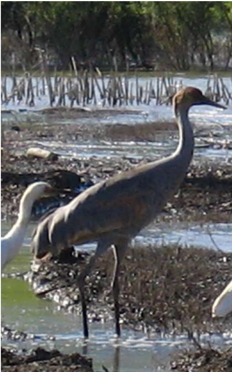
Figura 4. Grus canadensis juvenil. Laguna de Metztlán, Hidalgo.