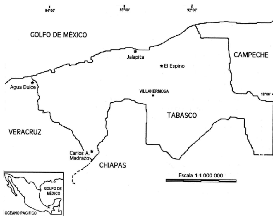
Figura 1 Localización de las cuatro áreas de estudio en el sureste de México.

39.729°W; 3) el ejido Jalapita del municipio de Centla, Tabasco, 18° 24.987'N, 93° 00.024'W, y 4) el ejido El Espino del municipio de Villahermosa-Centro, Tabasco, 18° 14.677'N, 92° 50.083'W (Fig. 1). En Agua Dulce, Jalapita y El Espino el clima es cálido-húmedo con lluvias en verano, mientras que en Carlos A. Madrazo el clima es cálido-húmedo con lluvias todo el año. En las cuatro áreas de estudio la temperatura promedio oscila entre 20 y 30 °C. La precipitación pluvial promedio varía de 60 mm en el mes más seco (abril) hasta 2,300 mm en septiembre, que es el mes más húmedo (García 1989).