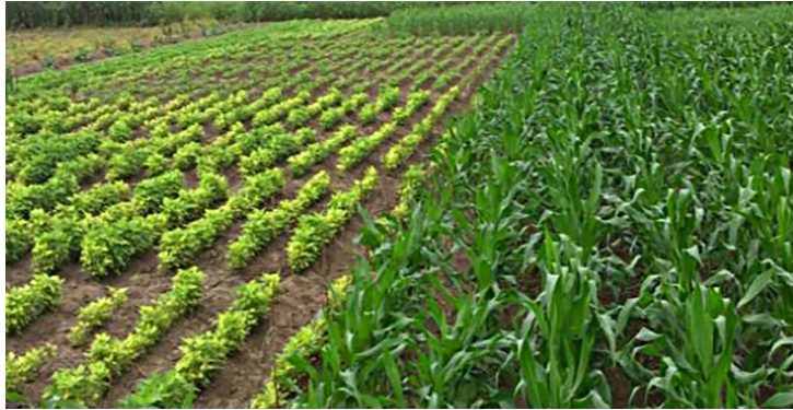
Figura 2. Aspecto general de los cultivos evaluados. En el lado izquierdo la soya contrasta con los demás cultivos con los síntomas de clorosis por deficiencia de Fe.